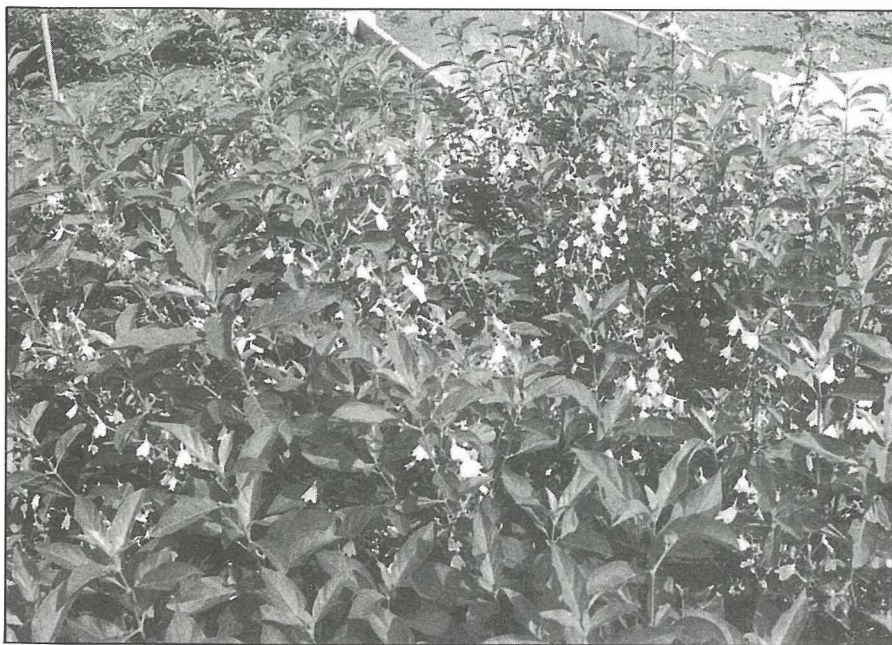
白鶴靈芝是青草茶主配方之一

用藥草做飲料在國內消費市場似有風起雲湧之勢，據筆者所知，農業試驗所和台東區農改場都曾推出類似產品，前者是用白鶴靈芝做“靈芝茶”，後者是用薑和柴胡研製“薑胡茶”，以及用蒟蒻做減肥飲料“蒟蒻靈”等。