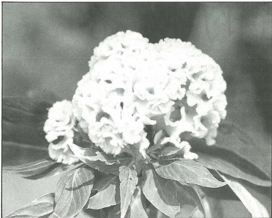
雞冠花不凋的秘密在於乾膜質花序