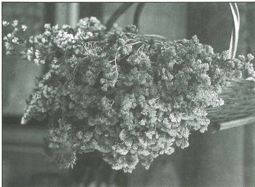
不凋花花期長，受到插花界鍾愛。