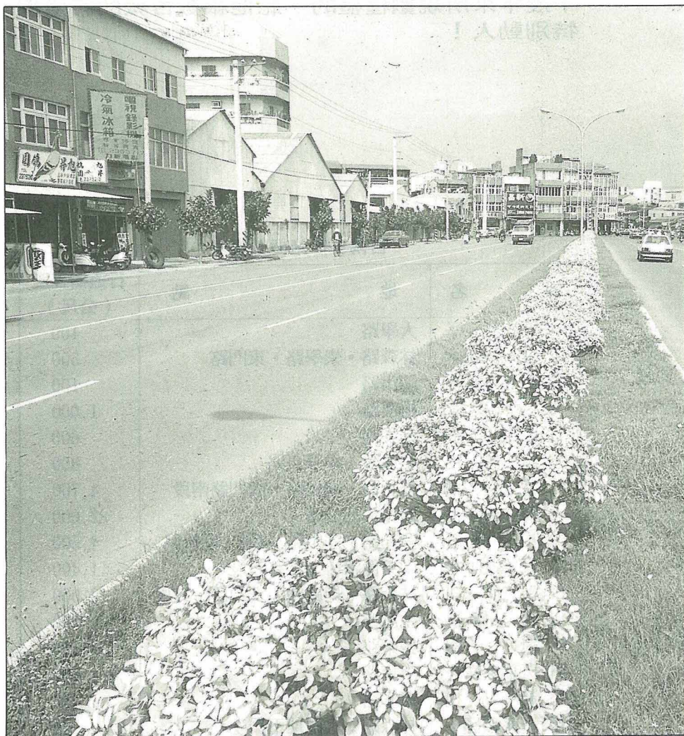
林森路安全島上植黃心榕