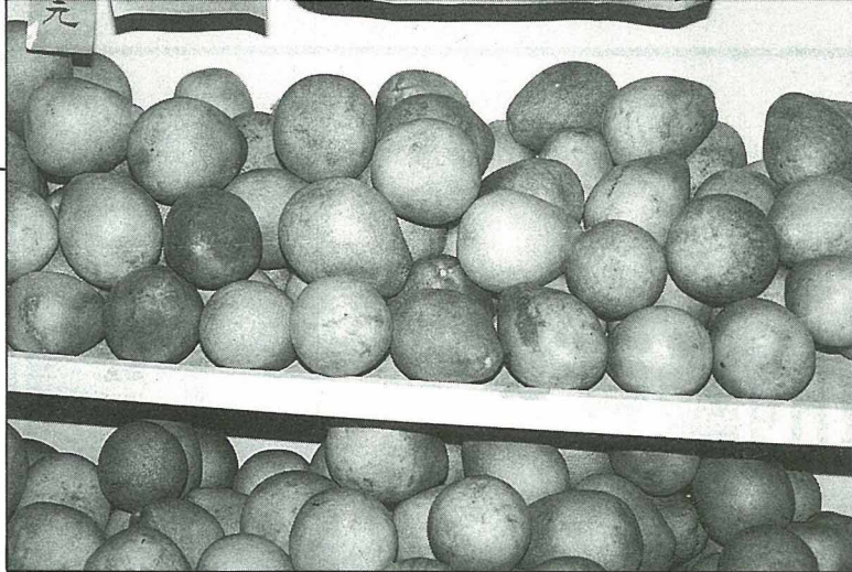
選購文旦時，以正三角形，具重感者為佳