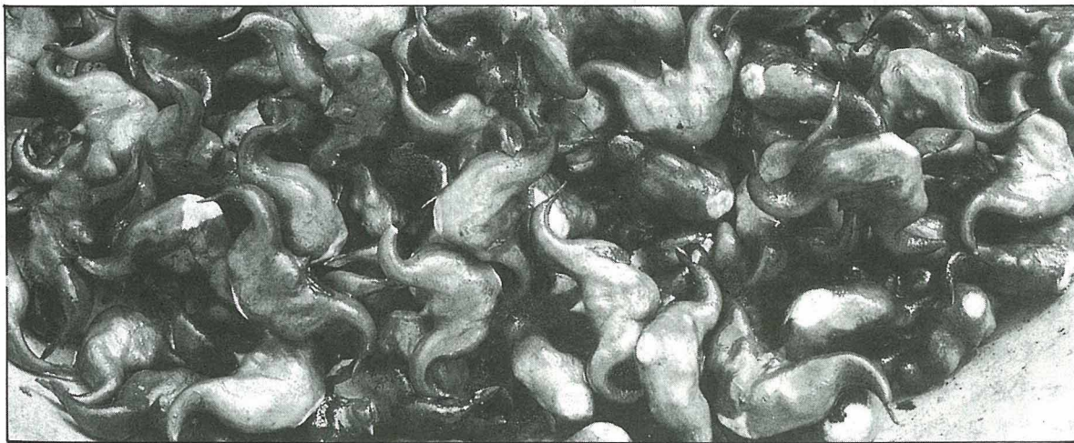
做為零食、蔬菜兩相宜的菱角