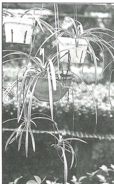
陽台不甚寬敞，可利用吊盆植物節省空間。