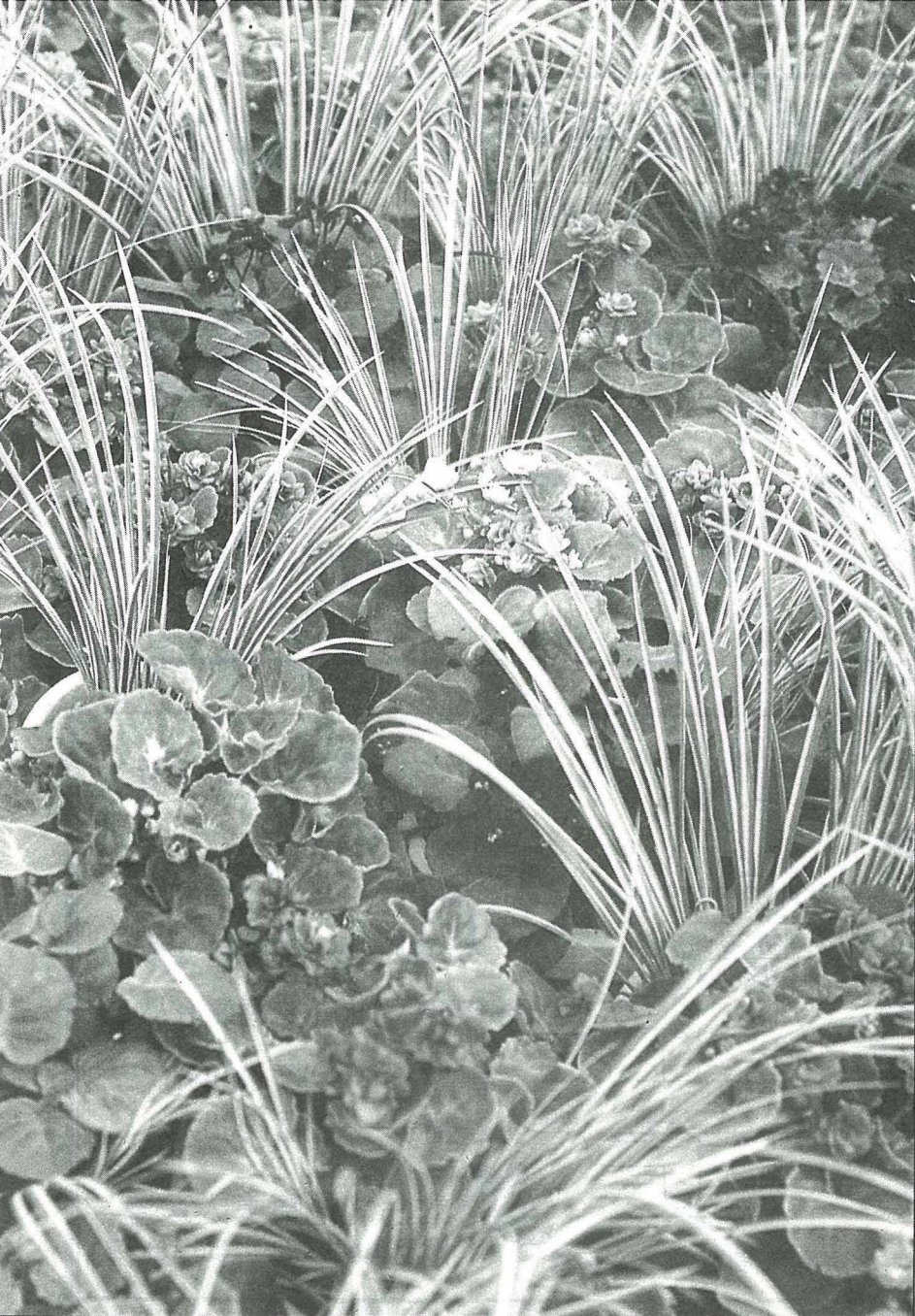
非洲堇耐陰性佳，是室內花卉的當家花旦。

性植物；而現今較受歡迎的均為耐陰性較大的觀葉植物，如蔓綠絨各類、黃金葛、黛粉葉、粗肋草、山蘇、椒草類、袖珍椰子、個頭大的有馬拉巴栗、千年木、龍血樹、鴨腳木等，亦是室內綠化的要角；而非洲堇、大岩桐可說是室內花卉的當家之花旦，耐陰性亦較其他花卉為佳，置於有散射光的窗邊即可開花，但須注意溫度不宜過高。