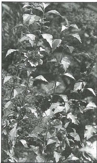
不僅須種在日照充足的地方。

蒔花種草是都市花農的份內工作，在種植之先，不要忘了“什麼環境種什麼花”這句口訣，才能事半功倍，享受美麗的成果。