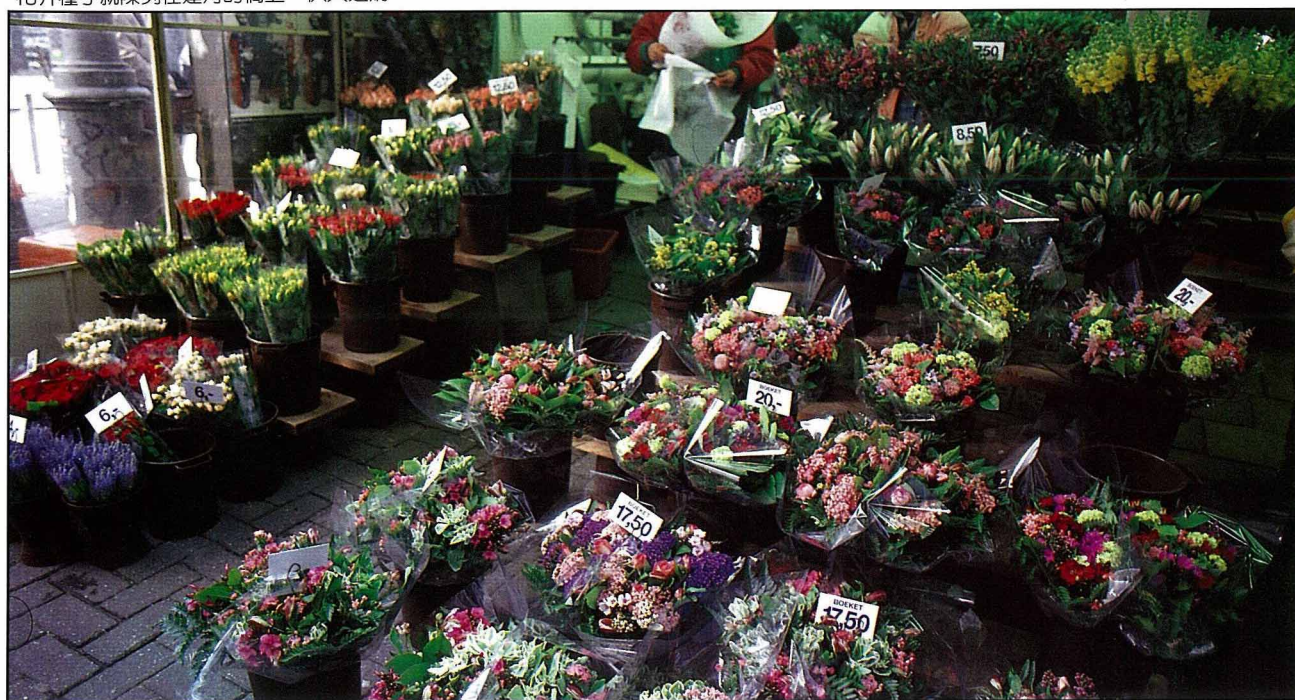
露天花市內陳列的各式新鮮的花及乾燥花

這座已有200年歷史的花市，沿著辛格運河邊展開，是一般旅荷的朋友最常到達的。花市的房舍皆低低矮矮的，而運河沿岸均植有高大喬木，因此行走其間感覺像在森林裡。