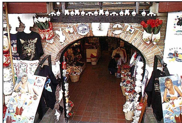
花卉消費的觀念在荷蘭十分普及