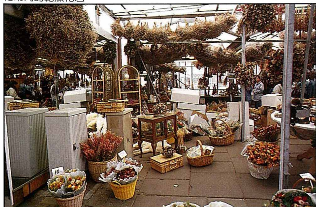
花市內的乾燥花店