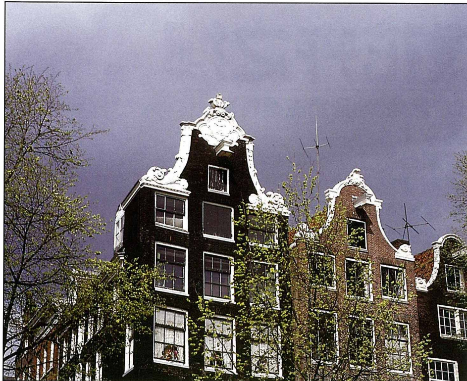
典型的荷蘭建築外觀，屋頂上的吊物架亦為主要特徵。