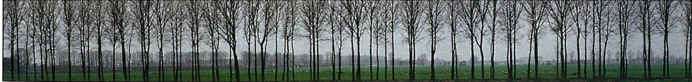
荷蘭對植栽相當有規劃，因此生長十分整齊。