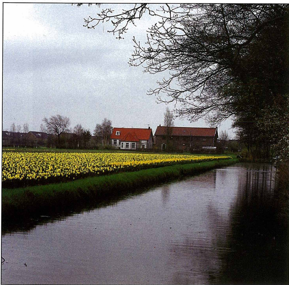
荷蘭的花田和運河

荷蘭本身以「低地」(Nederland) 地形為主要特徵，而The Netherlands亦成為荷蘭國名的由來。低地地形中的主要土壤為沙土、泥炭土和少部分粘土，這種土壤結構鬆緊適中，極適合球根花卉類的生長，這也是今日荷蘭花卉園藝事業興盛的主因之一。