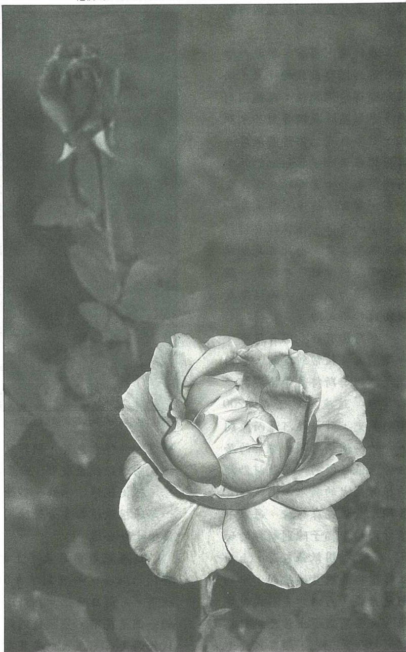
玫瑰或草花的葉背產生如生鏽斑的深褐色小斑點，就是已感染銹病。

盆栽放置的地點需通風良好，保持株距勿太密。施肥時，須注意勿施放過多的氮肥，否則細胞生長過快，造成組織不夠緊密，則易遭病菌侵襲。定期的修剪，清潔植株及盆器