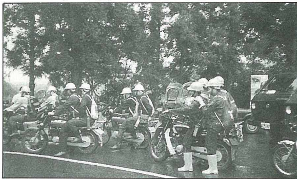
整戈待發的國有林巡護人員。

在當前土地過度開發之下，這片淨土實彌足珍貴。除了靠林務單位執行及貫徹法令來維護她的面容，更有賴每一位遊客付出真誠的愛，才能讓後代子孫繼續享有、保有她。