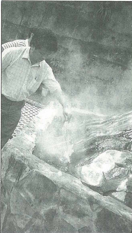
遊客在地熱井邊，利用捕鼠器煮蛋；水溫達140°C的熱泉，煮蛋最適宜。