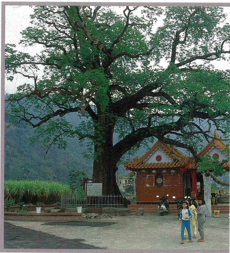
茄冬老樹旁常興祠立廟，成為民間的信仰活動中心。

早期的先民由大陸渡海來台，開墾山林平原，在福爾摩沙的土地上，留下了許多血汗和足跡。這些距今已有三百多年的史實，在今人眼中看來，也許只是個歷史名詞，甚或只是個模糊的概念；但由舊地名中，却不難想像當年的艱辛。像茄冬、芎林、高樹、竹山……等地名，便是以當地的植物而命名的，雖然今天這些地方不見得和地名的印象相互呼應，但我個人確信，這些地名的