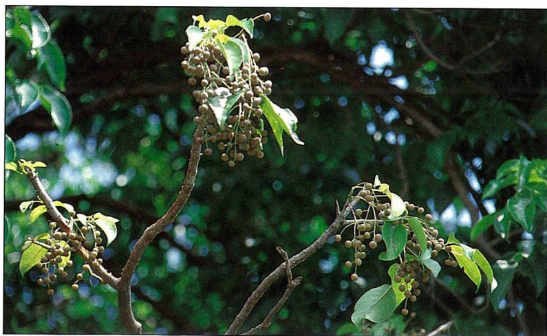
茄冬的葉、枝、果實是常用民間藥，其果實像小號的龍眼。