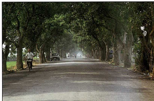
嘉義豐收村三興路段的芒果行道樹。