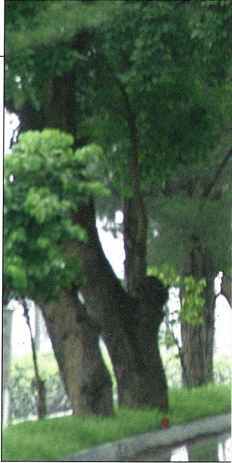
台東卑南茄苳行道樹

大自然的綠色資源對於人類身體及心理健康所能發揮的效益，早已是醫學上不爭的事實，然而，具有無限功能，必須數十年漫長時間才能茁壯長成的林蔭大道，卻被文明人類以萬物主宰者的身份，在短短的時間內無情的伐倒殘害，一株株的大樹，綠色的隧道，旦夕之間蕩然無存，綠資源的扼殺，成了人類自己的惡夢。誠然，社會必須進步，必須建設，但我們對環境保育的警覺一直不足，因此，有許多的美麗景緻從我們的手中興起，卻也從我們手中幻滅。如果我們的規劃能多一分考量，多一分關心，相信可保存更多的資源留給後代子孫，而台灣的行道樹也只有在大眾正確的認知與關愛下，才有生存下去的機會。