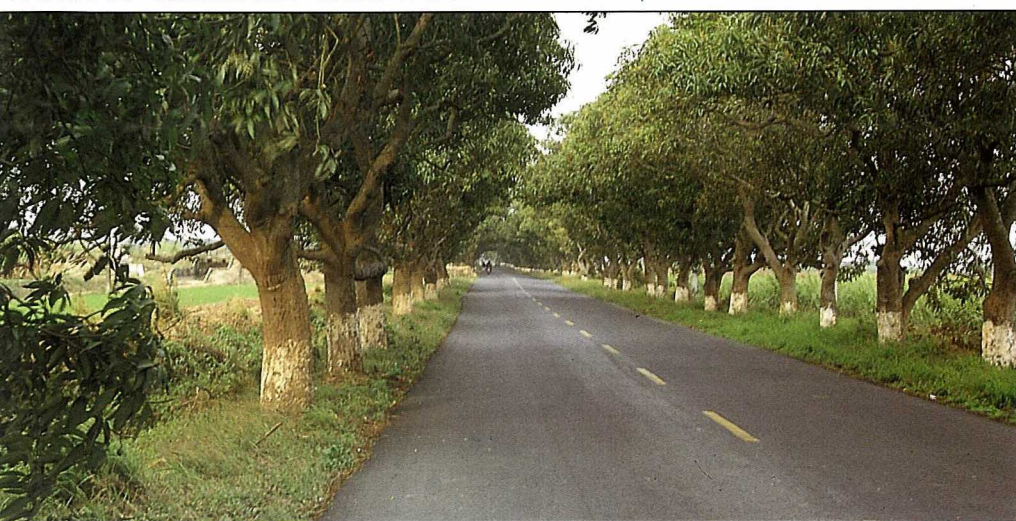
台南柳營太康到小腳腿段的芒果行道樹。