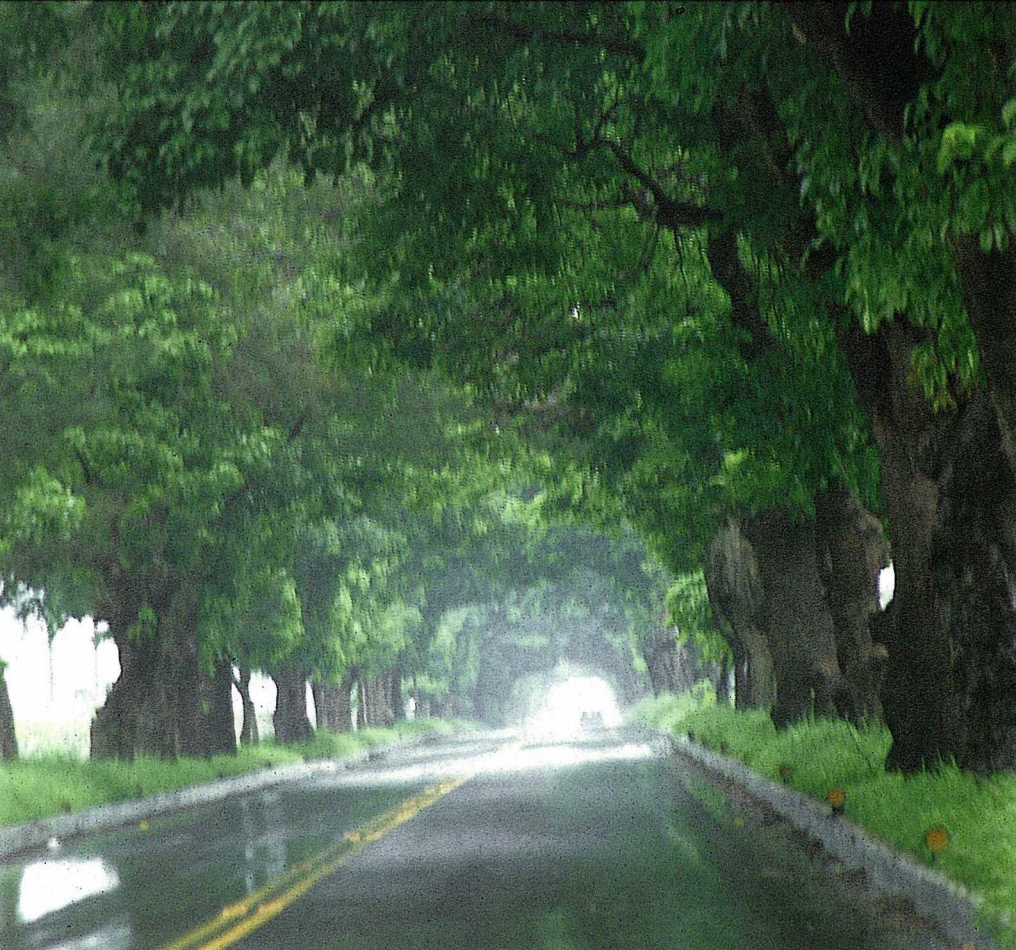
珍貴行道樹彙整表