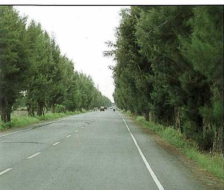
木麻黃行道樹，為兩旁農地擋風、防塩霧三十餘年。