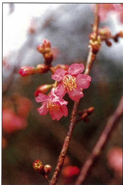
種植櫻花，應給予陽光充足、通風良好的環境

同地區的寒緋櫻，花開花謝，約可維持10天，花後結成綠色小果，繼而變紅，熟透後帶黑色，綠葉紅果相襯托時期也頗有觀賞價值。熟透果實，甜中帶酸澀，可以食用。如要實生繁殖，可以將其除去果肉後以濕砂層積到第2年早春播種，在夏季時實施芽接或秋季行切接或割接，約過5年可以開花。