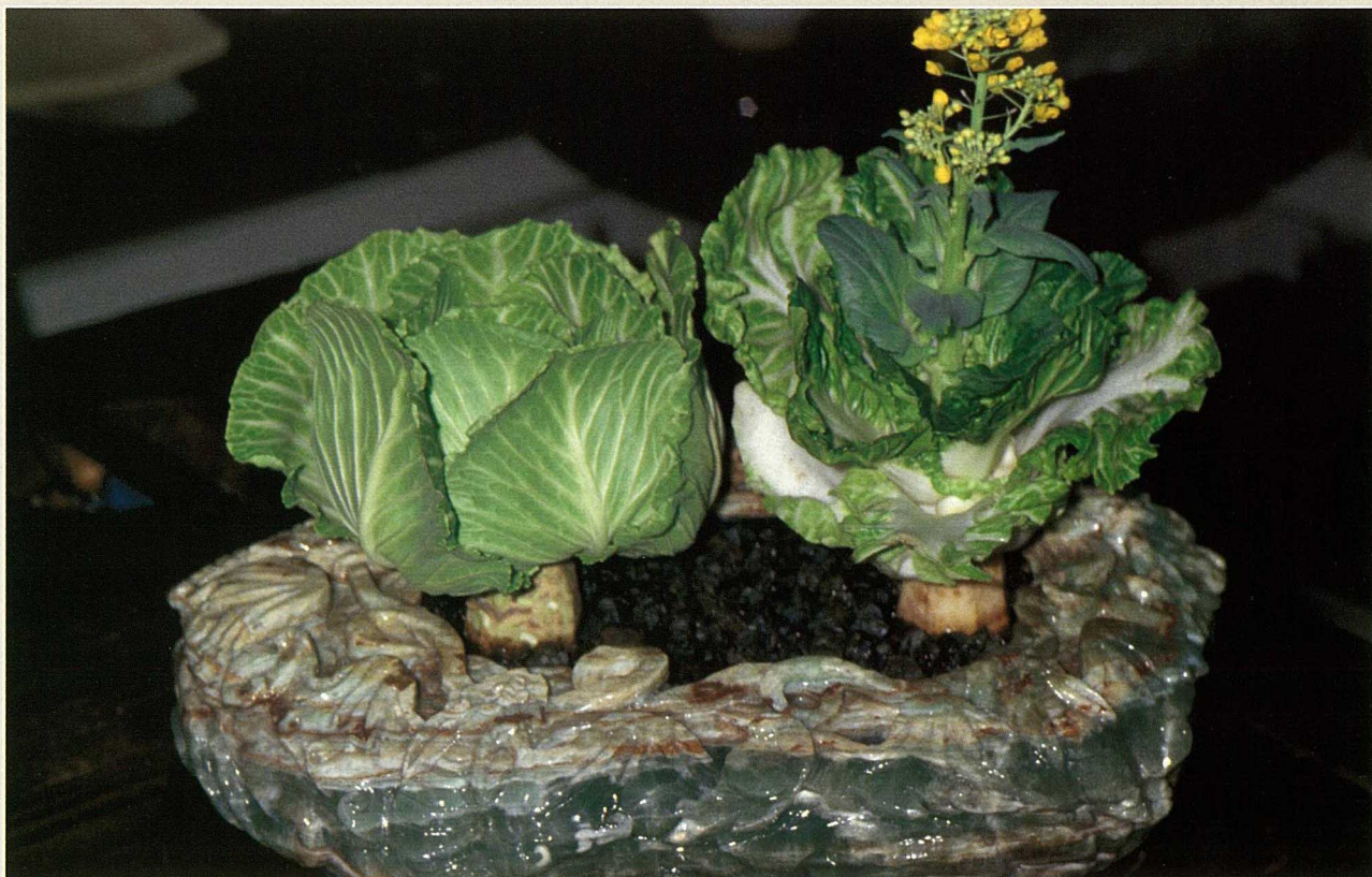
平凡的白菜在玉石容器的襯托下，更顯氣派。

的容器內裝麥飯石及水來種植，不必另施肥料，就能讓它從二度發根、長新葉，到開花為止，足足可擺上3個月之久。