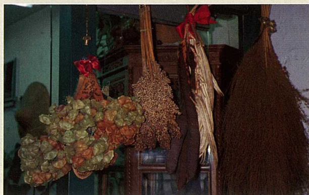
「麻雀窩」裏的乾燥植物很奇特，如圖中的倒地鈴、鳳凰花莢等。