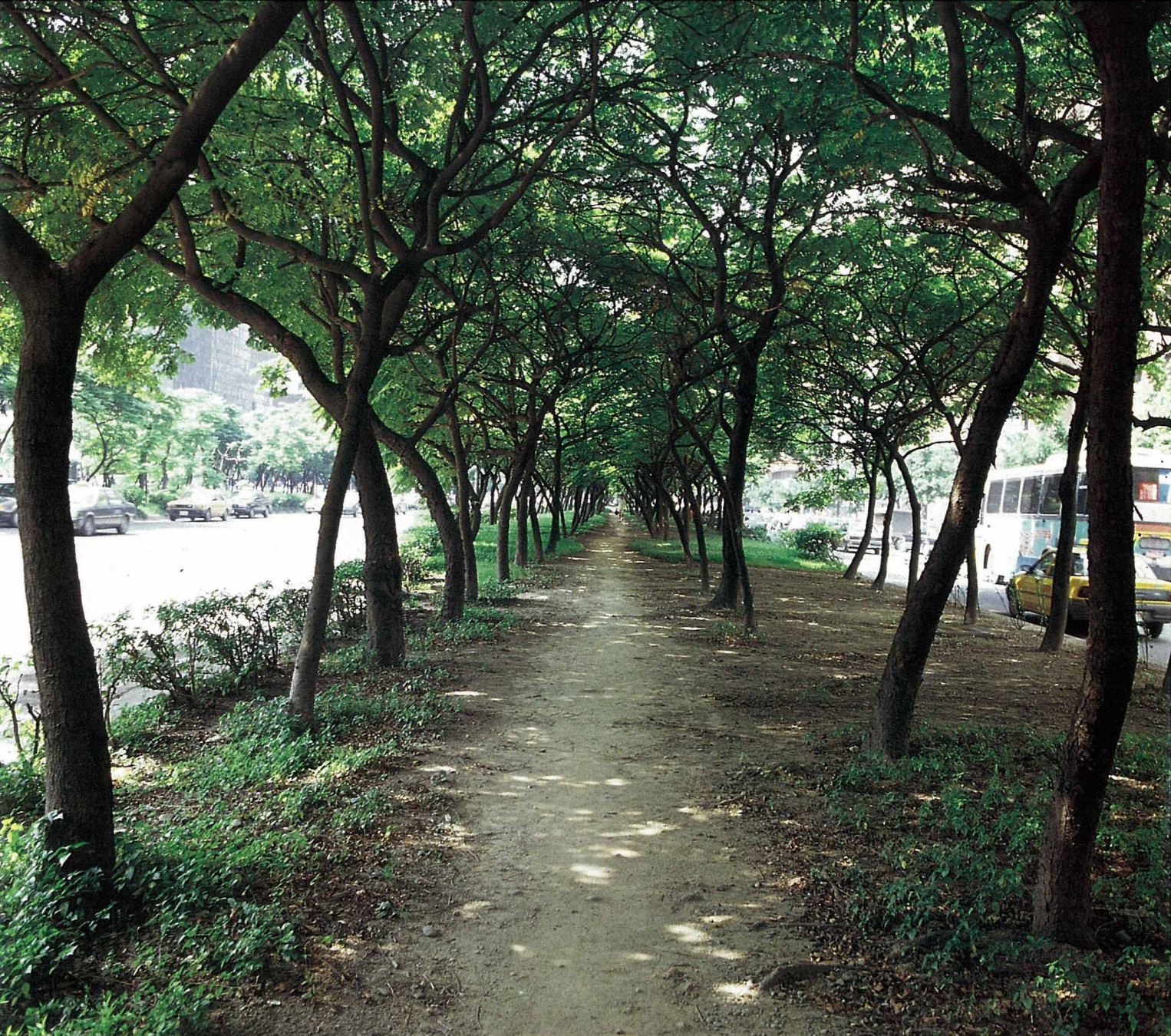
敦化南路上的台灣欒樹行道樹