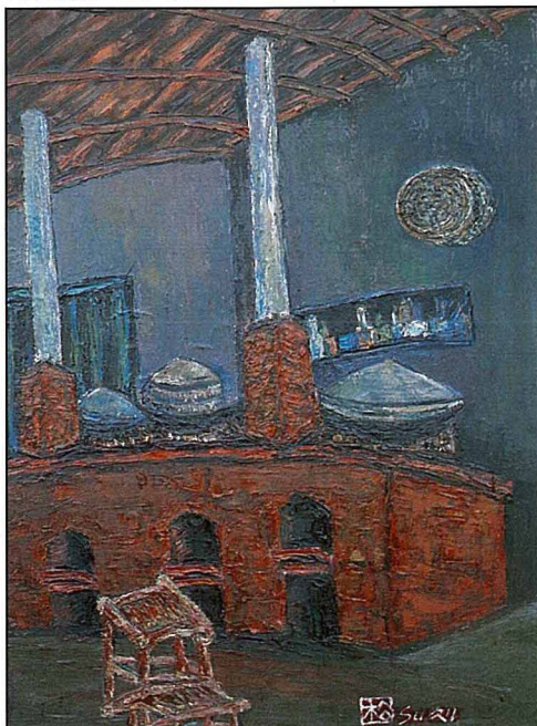
◀【圖四】「寺廟」台中霧峰的果農黃粟生，現年七 十七歲。他於農閒經常利用廣告顏料於肥料袋紙上 塗抹作畫，除了畫農家生產故事圖外，也畫民俗廟 會的喜慶。