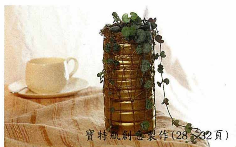
封面設計／林朝宗