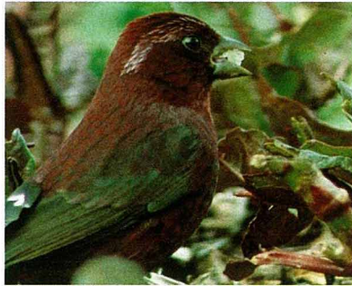
酒紅朱雀

大蒜的故鄉——荊桐鄉……………23 大蒜小統計……………25 蒜頭・每天2瓣……………27 休閒農場讀者優惠券……………43