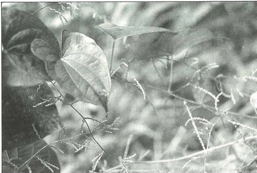
山藥在本省中南部栽種較多，約有10個品種。

由於山藥具滋補的功能，是過去婦女做月子最好的補品。但因物質缺乏，食用方式大多單純而少變化。今人以山藥煮粥，烹