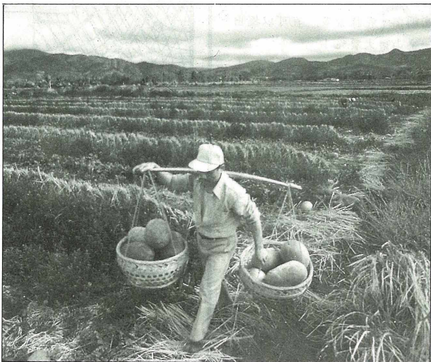
屏東大西瓜4月搶先上市

每年4月以後，平地的菠菜幾乎無法栽培，產地移到幾處高冷地帶。宜蘭縣的大同鄉、桃園縣的復興鄉以及梨山地區都是重要的產地。大同鄉和復興鄉的出貨期比較早，尤其是大同鄉，4月中旬以前就可供貨；復興鄉則要等下旬以後；至於梨山地區則又更晚，6月間才能上市。