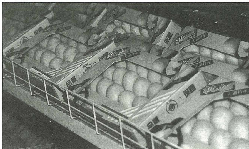
大湖枇杷在產地已做好零售包裝

屏東大西瓜，多數為“富寶”系統，果體都相當大。消費者多半不會買整個西瓜，而是在路邊購買小販已合切開的部份。其裡外既多能一目了然，選購的時候，可視其果皮之厚薄而定取捨，果皮厚者可食用部份必然較少，因此以購買果皮較薄的為宜。◆