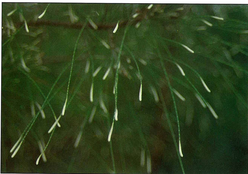
木麻黃的雄花盛開時，葉端好像附上新降的初雪。

木麻黃因淺根系及蟲害的緣故，不是死於蟲害便是被強風連根拔起，因此並不長壽，在台灣少見巨齡的老樹，而且於公元1910年至1913年間方才引入台灣