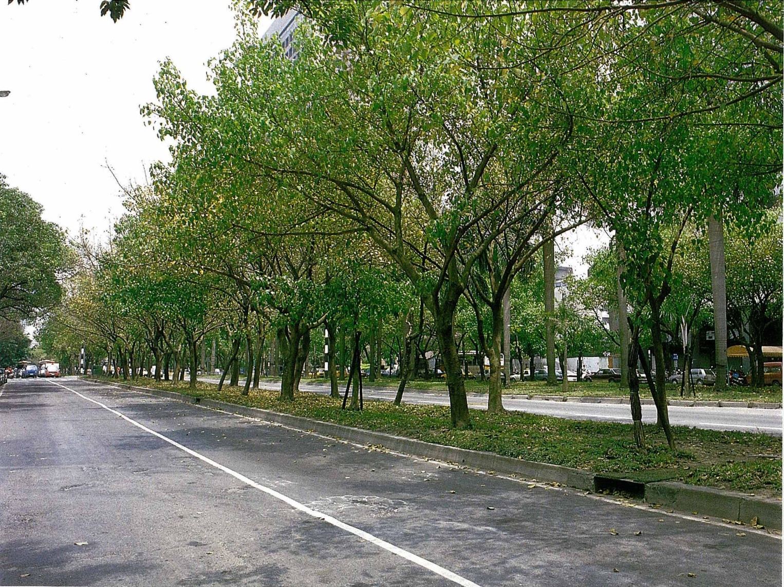
台北市仁愛路上的菩提樹