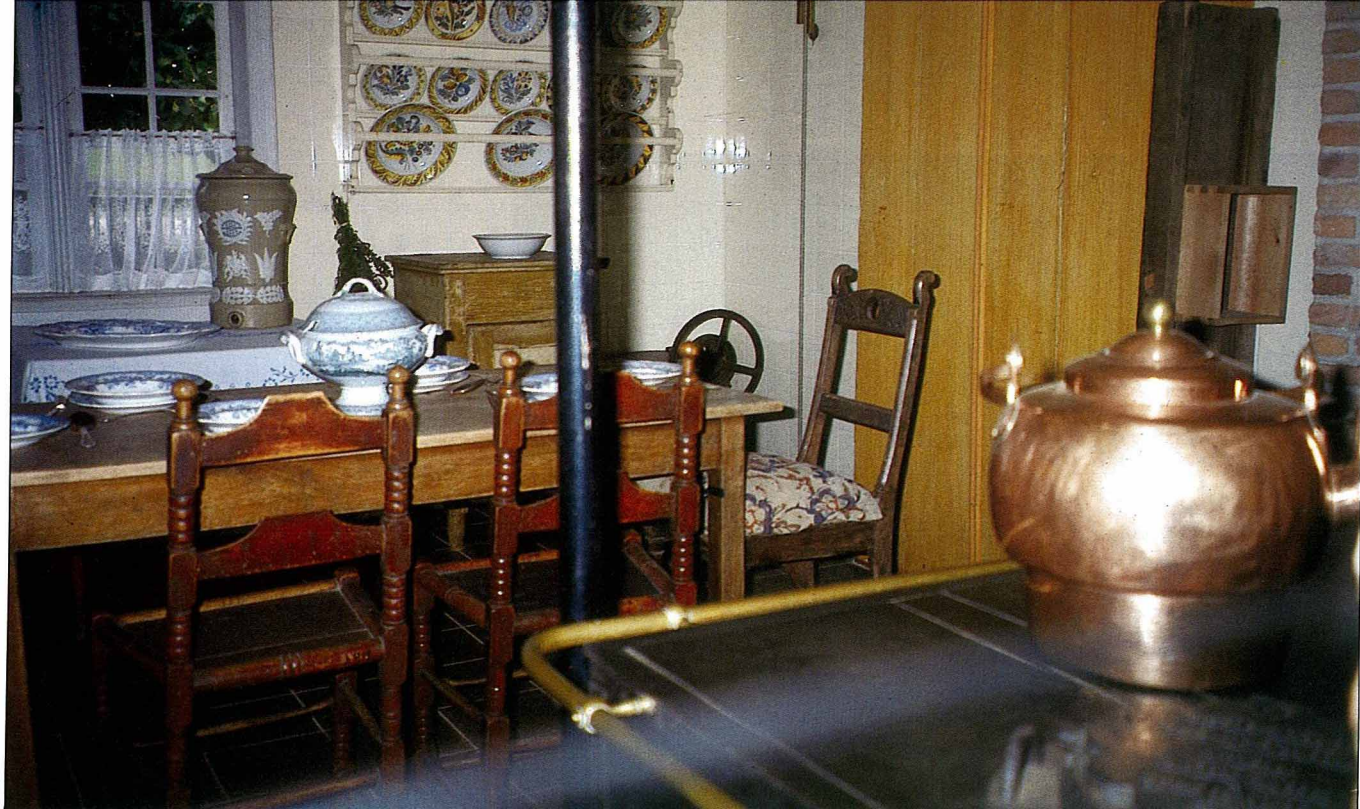
原狀保持的十八世紀農家餐廳