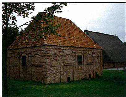
1782年代，人畜分居的傳統農舍。