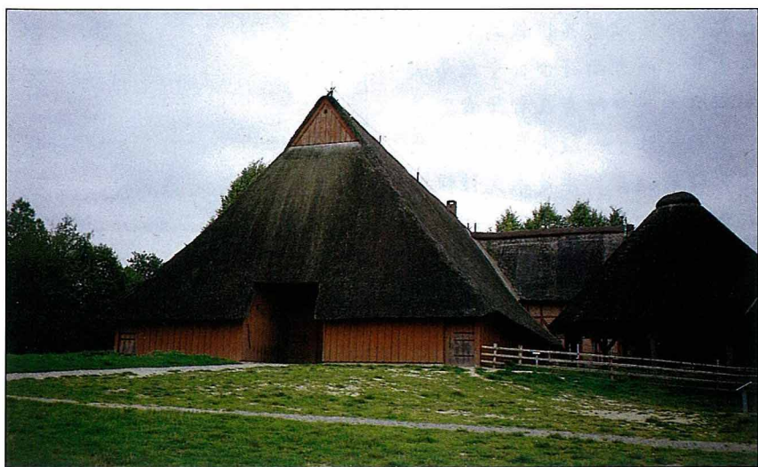
1629年代，人畜共居的古農舍。

他有代表性的建築物。另外，能夠呈現產業革命之後一些工業化過程之證據也受到保護，例如天然氣工廠或採煤廠乃至煤礦坑等有系統的研究，並將現場實況搬進科學博物館內，或在當年工作