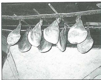
德國傳統的煙燻火腿

分年青人離農往城市發展，農村人口老化的結果，農業自動化，農莊多餘的房間多半由老夫婦兼作民宿賺取收入，由於德國政府推行農村及偏遠地區廣為設置傳統特色主題博物館及民俗村，利用電視製作專集旅遊報導吸引大量遊客，帶動地方經濟繁榮。在規劃設置博物館同時亦作好大量遊客同時帶來之垃圾、廢棄物排出、公共廁所及給排水、地下排水設施、電力、能源及交通、停車、住宿等基本民生需求基層建設。因此，大量觀光客並未帶來污染問題。