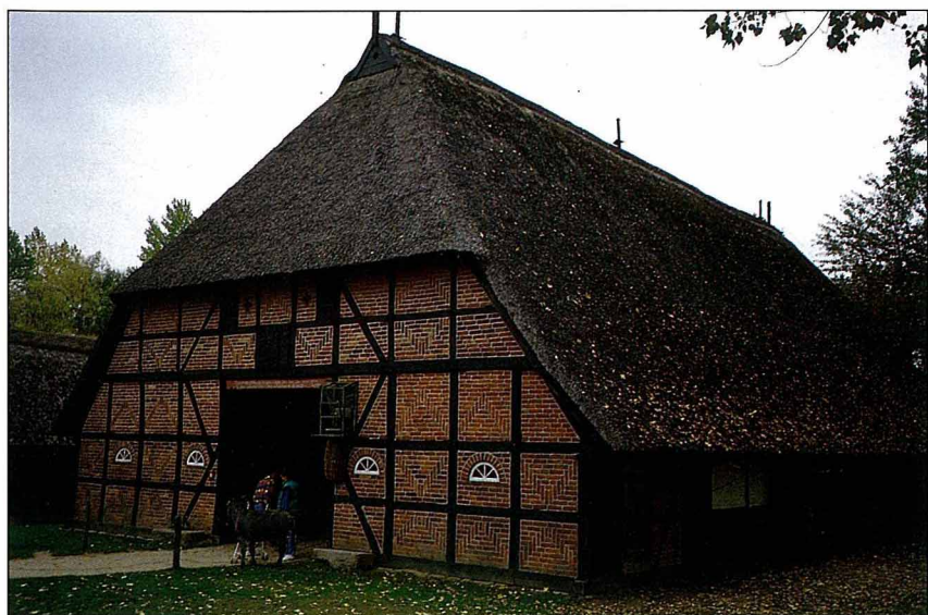
1700年代，人畜分居的磚造農舍。