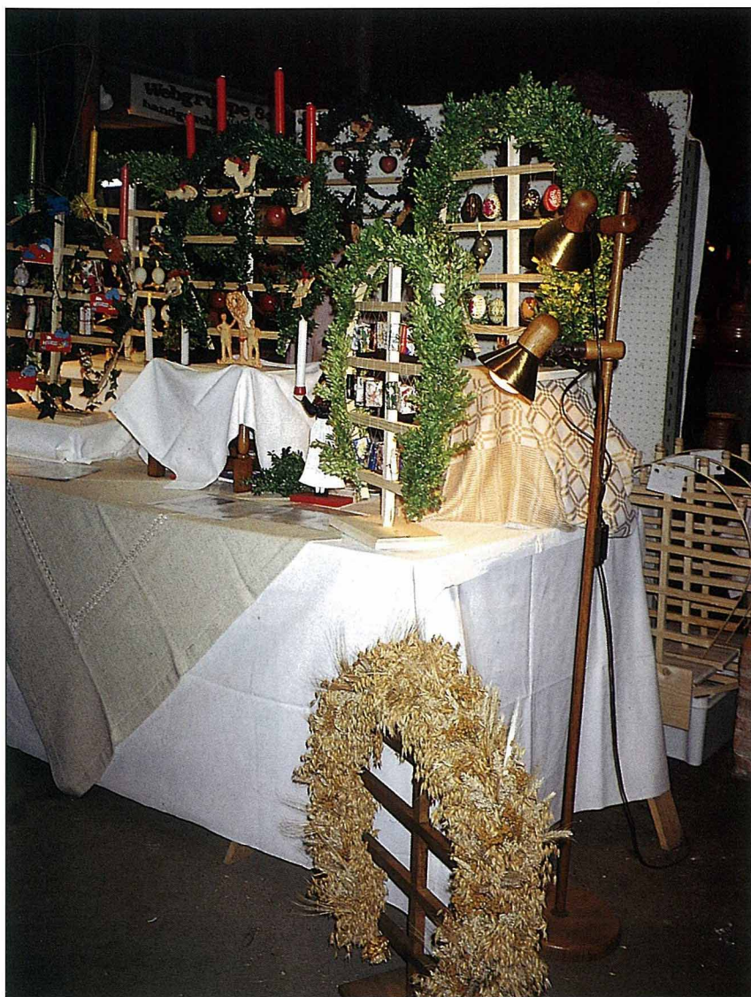
手工做的聖誕節禮物