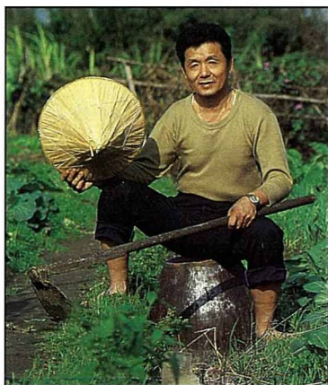
【圖一】「故鄉」，泥土＋稻草＋草＋彩繪，1991。