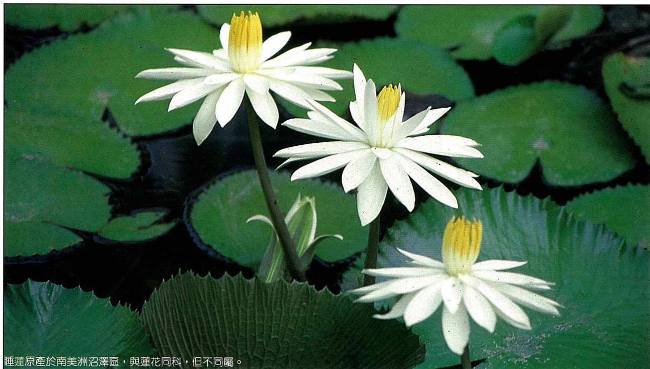
睡蓮原產於南美洲沼澤區，與蓮花同科，但不同屬。

目前本省荷花栽培最多的地區當屬台南縣白河鎮，另外花蓮光復鄉也正在全面推廣示範蓮花池，大有後來居上的架勢，這個