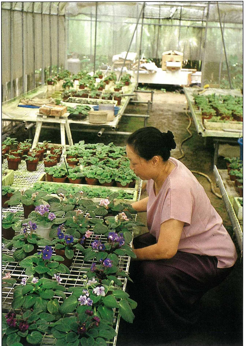
不論早晚陰晴，童倫都得親自探視她的非洲堇。