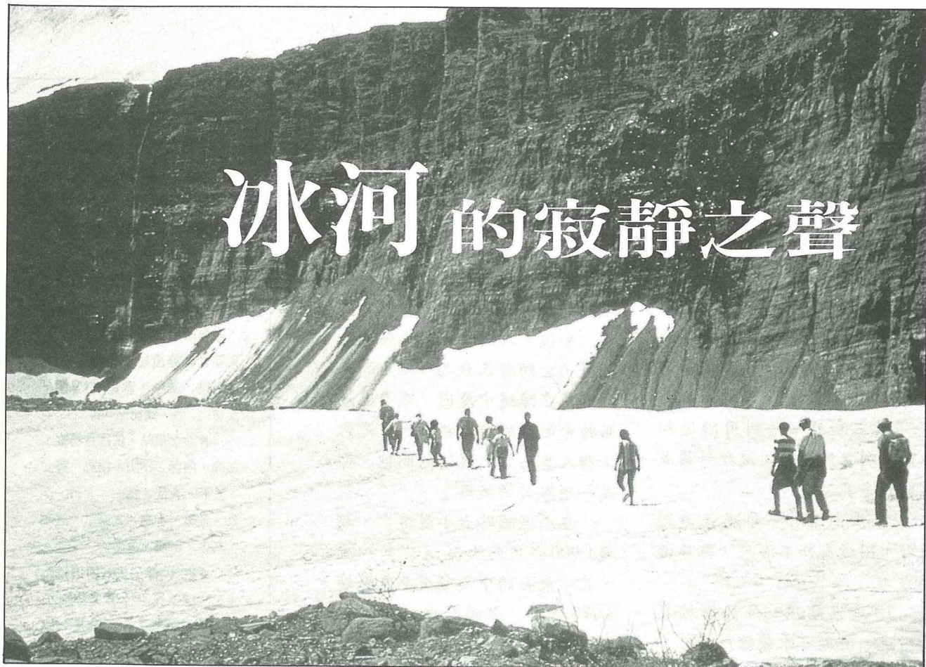
冰河切割所造成的壯麗景色，讓人類感到自己的渺小。

我們站在美國蒙他那州西北部的冰河國家公園山上，我妻子說，聽！你聽到了嗎？這時候實際上是寂靜無聲，完全的寂靜。展開在眼前的是一片壯麗景色，那是由於大自然的劇烈運動所造成的壯觀：被大海淹沒，受造山運動所隆起，為冰河所切割所形成的。