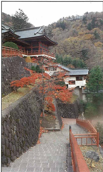
中禪寺的美麗紅葉。