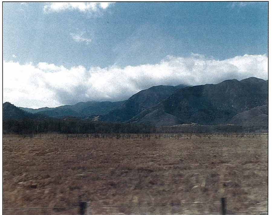
昔日古戰場，今日滑雪場。