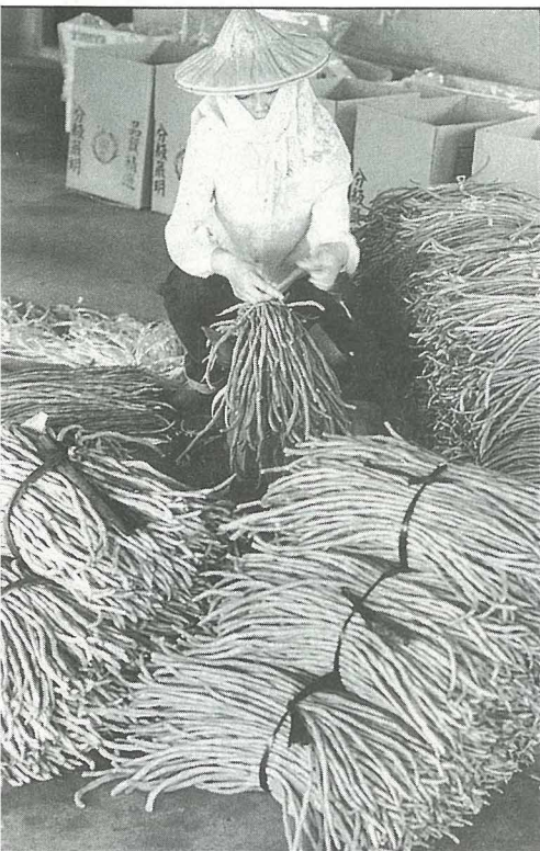
8~10月，市面上的紅豆全是嘉義貨的天下。

地；也有一些產品，來自於台南高雄間的山區地帶。不過，由於氣溫實在高，有些筍子耐不住高溫，很容易抽空而成為幼竹子，品質差一些。