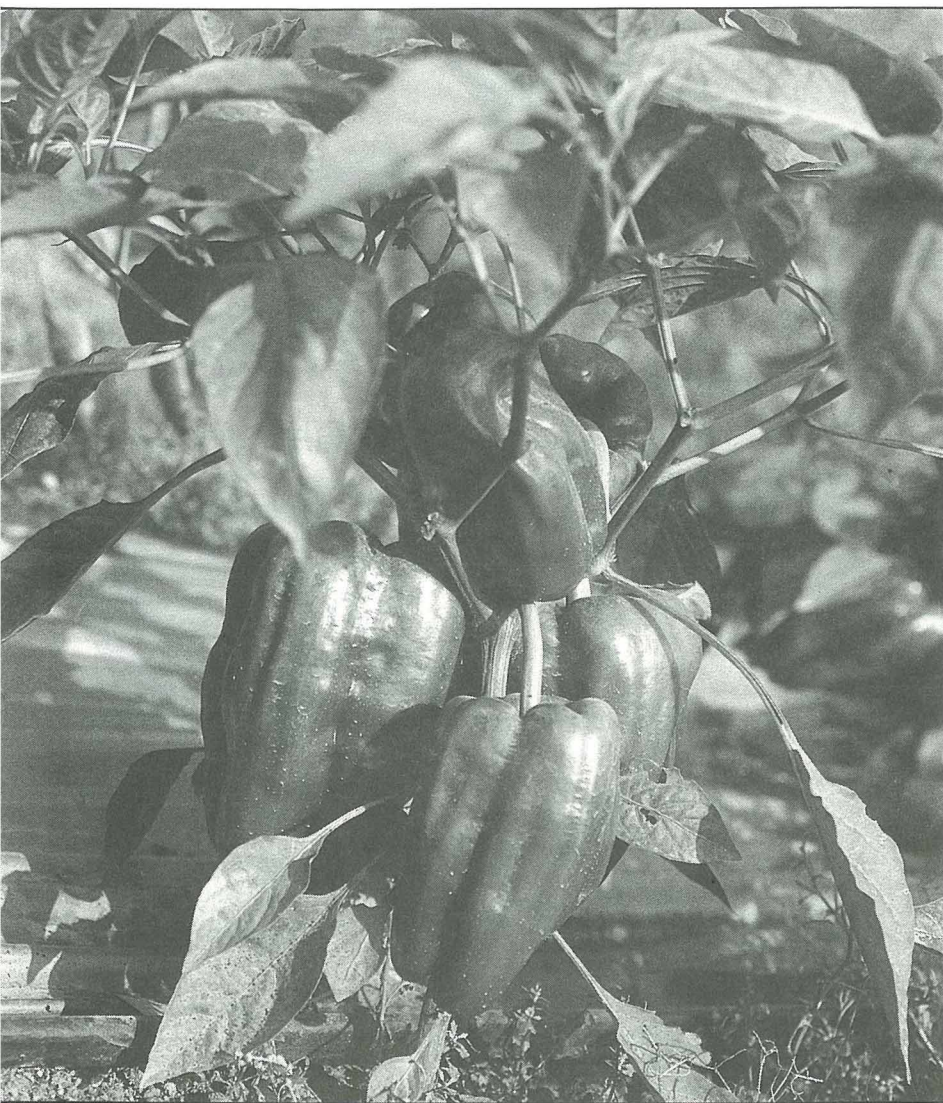
7月中旬至10月初，甜椒供應幾乎全部仰賴新竹山區。