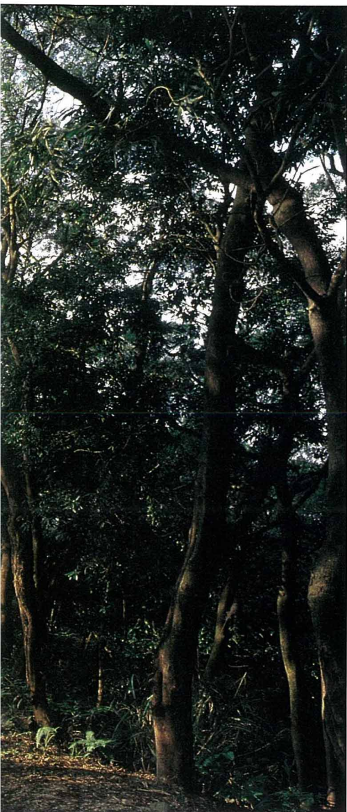
舒爽宜人的相思樹小徑

相思樹的時代雖然過去了，但相思樹動人的季節演出，千百年來卻未曾終止。這種源於季節的微妙變化，到如今依然能輕易捕捉您的眼神，如果您的詩情率性不曾因都市洗禮而泯沒，那麼迷人的相思樹仍能日夜牽動您的心靈，引導您做另一種完全不同的相思。