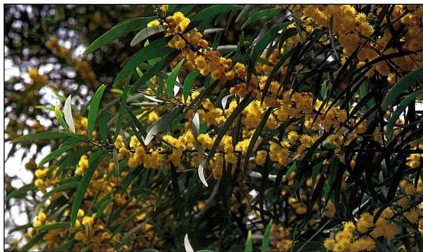
相思樹花序，像極了金黃色小粉撲。

以下的地區，是本島造林面積最大且最普遍的樹種，幾乎到處都看得到。這些年環境保育的口號高唱，許多人響應種二千萬棵樹救台灣，我看報導上的樹種也有相思樹。前些年世界地球日還送人相思樹的種子，鼓勵大家多多栽培。即便是如此的鼓吹，相信真正瞭解相思樹和喜歡的人仍然有限，更遑論去欣賞它的四季風情了。