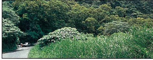
盛花期的相思樹在林相中十分明顯