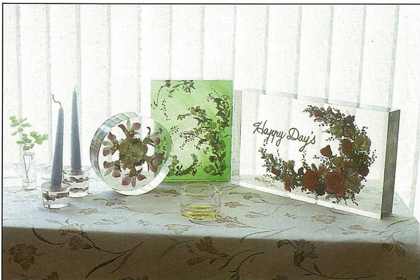
左三及右一為立體花的應用