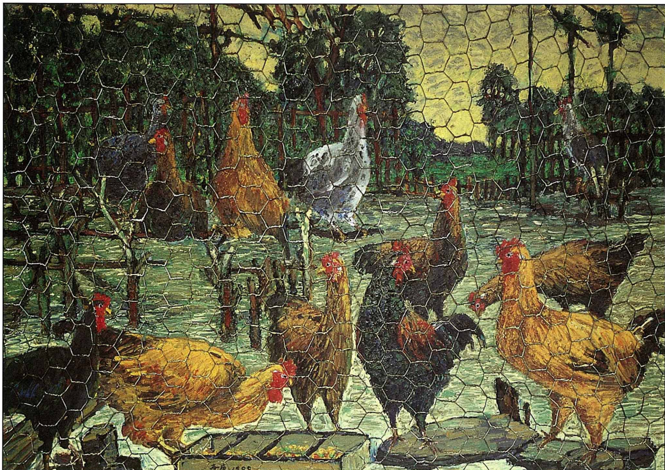
【圖六】「九斤雞十二隻」， 油畫，1988

12隻健美的「九斤雞」在黎明曙光中甦醒，有的昂首張望，有的低頭覓食，畫者以真正的鐵絲網罩住雞群，表現出農家雞舍真實的情趣。