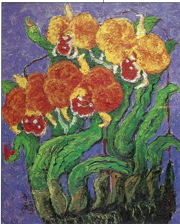
【圖七】「蝴蝶蘭」，油畫，1991 艷麗的色彩，老辣有力的筆觸，把花朵的生命燦爛的呈現。

郭先生的人物畫，早期企圖透過西洋畫的筆法追求繪畫圖象的記錄性；內容包括「休息的勞動者」、「持香禱告的信徒」、「拿著國旗的農民」、「弟弟的婚車」、「炸油條的人」。1988年以後的人物畫有了新風格的突破；「畫家與錢」和「智者的塑像」都是畫家本人的內省圖像，而「親情」和「外婆說故事」，則是畫者家族親情的記述，也是台灣現代家庭的社會變遷省思。郭奇康的油彩人物近作，呈現的是台灣島國的人物詩情。時裝人物被安置在神話境界的天地裡，現實生活的壓力逼使人人神情肅穆；花木盛開的詩情背景，隱含著對幸福歲月的期待，這系列作