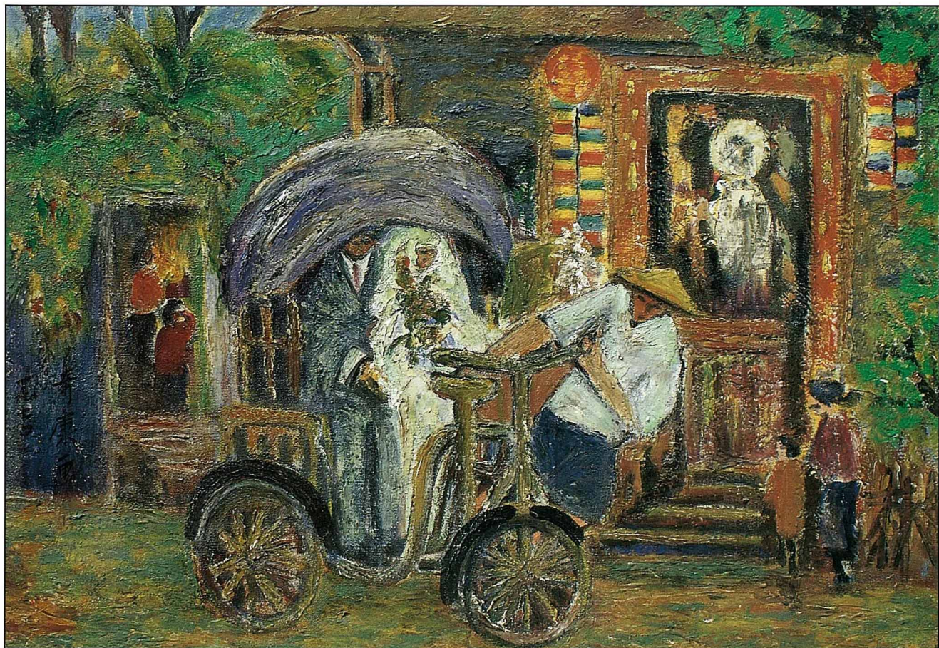
〔圖四〕 「弟弟的婚車」，油畫，1970

以滷厚的色彩，緬懷式的記錄了弟弟結婚的禮車，是台灣光復後平民式的三輪車結婚儀式。