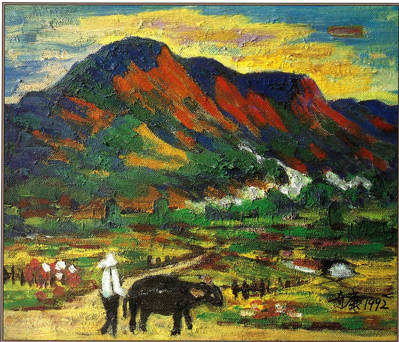
〔圖一〕「火山山脚」油畫 1992