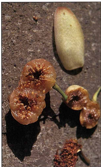
雀榕的隱頭花序及果實。

伽南又名奇楠，其產生是因樹年久而內枯，因此產生洞穴，而螞蟻便寄居為巢，由於螞蟻所食石蜜遺漬其中，歲久漸浸，受石蜜氣多，所以凝結而成堅潤的伽南香。」伽南香經常與沈香相提並論，主要是兩種香特性正好相異其趣。古人相信，伽南香有閉尿的功能，因此本草綱目拾遺中便留有「忍溺法」的秘方，有興趣的讀者不妨自己研究研究。據說古代如廁並不方便，上朝時費時甚長，為了避免朝君時出糞，「忍溺法」便成了必備的知識之一。除了用伽南香之外，還有使用陽起石的，這兩種物品的使用方