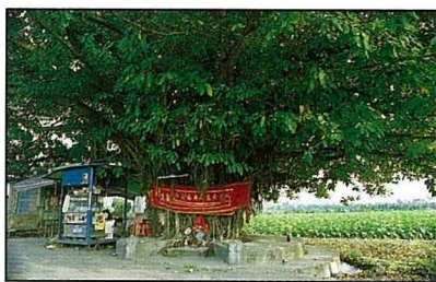
百年老榕每成爲地方信仰中心， 興祠祭拜蔚成風氣。

榕樹在我國多產於兩廣和閩 南一帶，因此與閩南兩廣地區 的生活有很密切的關係。事實上， 正榕與雀榕的栽培在我國的文獻 紀錄裡，至少已有一千年以上的 歷史了。雖然榕樹的週期變化和 花色並不突出，但遮蔭極廣而且 蒼勁有餘，因此古時候為之填詞