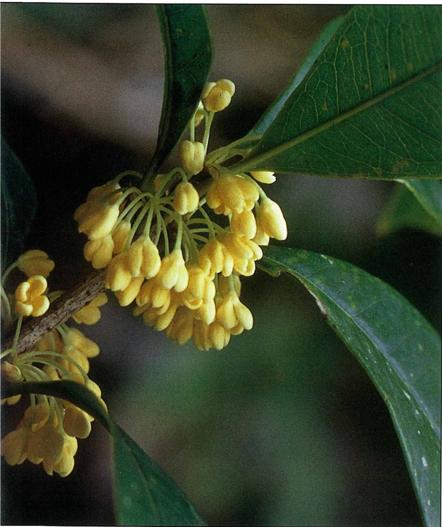
早期婦女的嫁粧中，桂樹和石榴都是必備的物品。

詩書的才女，她即是唐太宗的妃子徐惠。據說徐惠是湖州長城的一位天才兒童，生下來5個月即會說話，4歲能讀論語，8歲會作詩寫文章，她父親曾有一次想考考她，就叫她模擬離騷寫篇關於桂的文章，徐惠提筆即寫了「仰幽巖而流盼，撫桂枝以凝想，將千齡兮此遇，荃何為兮獨往……」自此文名遠播，後來連唐太宗也聽到了她的文名，就召她入宮，封為「才人」。唐太宗駕崩以後，徐才人因哀傷過度成疾，並拒絕服藥，終以身相殉，追隨君