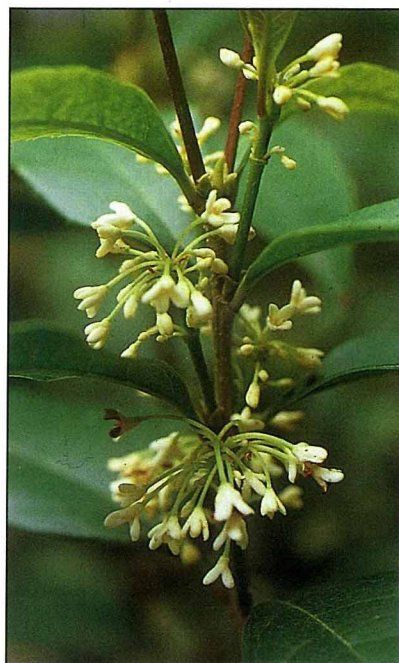
桂花除了可供觀賞之外，更具有食用的價值。

觀賞用，也可供食用，如桂花以彩線穿成串，謂之桂球；以子熬膏，謂之桂油；夏初取蜂蜜不露風而合煎十二時，火候細熟，食之清馥目美，謂之桂膏；貯酒瓶中，待飯熟稍蒸之，謂之桂酒；甚至連桂花浸漬過的水也稱之為桂水。應用之廣，花樣之多，真是令人歎為觀止，詩意極了！不