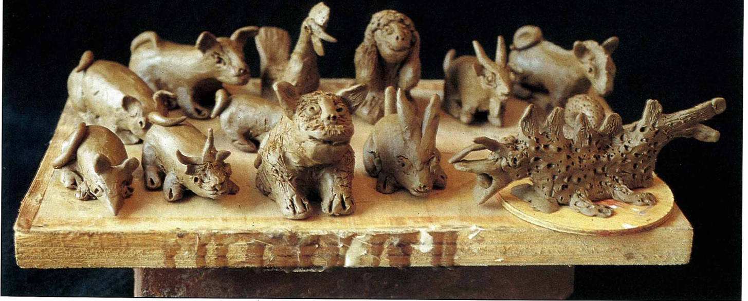
【圖四】「十二生肖」油土捏塑，1992