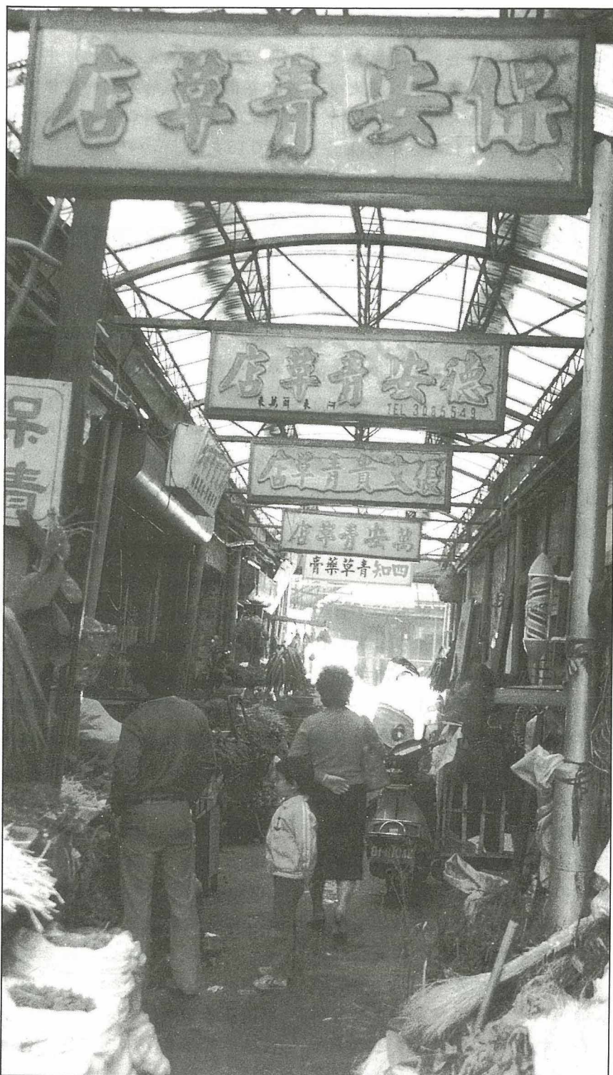
青草店所出售的新鮮藥用植物如茅根、蘆薈等，應該不含西藥成分。

今年八月份的消費者報導有一篇「透視中藥」，指陳在中藥中檢驗出多種西藥，而且有早在8年前就由衛生署公告禁用的4種西藥。