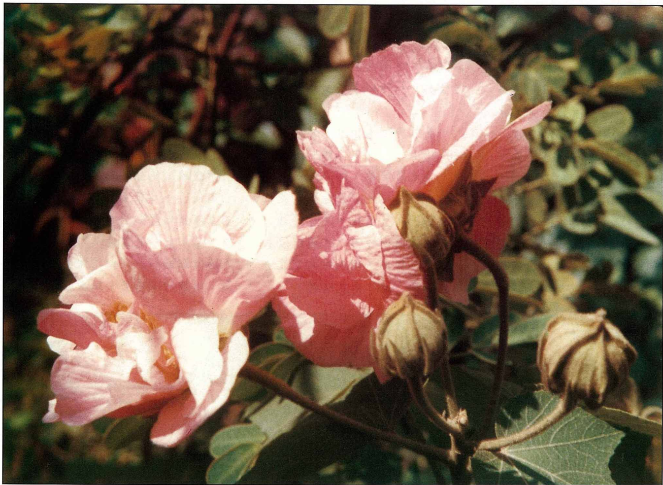
原產於中國大陸西南地區的木芙蓉， 品種多，花色也多。