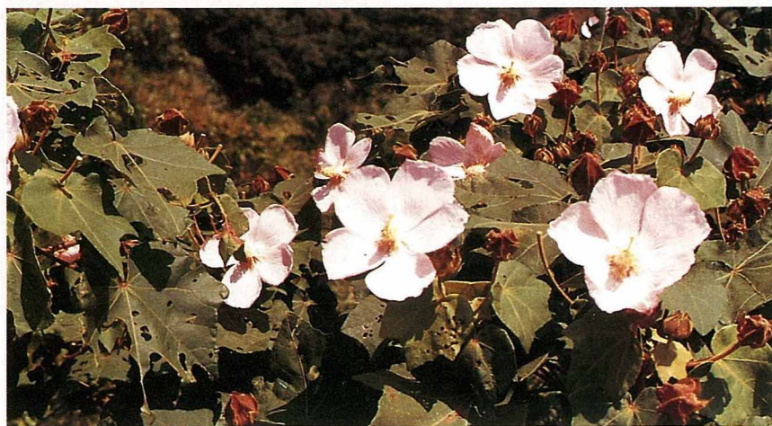
生長在台灣的花芙蓉，一年四季皆可開花。

芙蓉有草本和木本之分，石林燕語：「芙蓉有二種，出於水者，謂之草芙蓉，即草蓮也（荷花）；出於陸者，謂之木芙蓉，即木蓮也。」因此，又有詩云：「莫怕秋無伴醉物，水蓮開後木蓮開。」現在一般人叫木芙蓉通稱為芙蓉，以和蓮花區別。