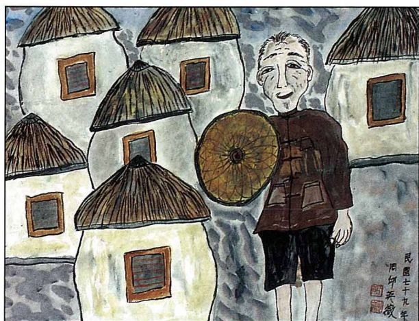
【圖四】「鼓井擔水入甕缸」，彩墨，1987

每個農莊的公共路邊，都開挖一座鼓井；左鄰右舍的村婦黃昏時都來汲水，挑回儲存於水缸備用。