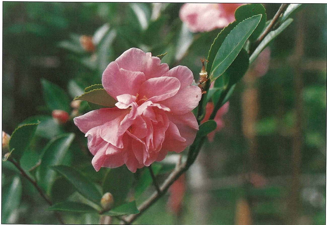
茶花和我們日常飲用的茶，是同科不同屬的植物。

課童。」只可惜，本省由於氣候之故，少有盆栽栽培作品，庭園也多分布於北部地區，欲賞茶花可在11月至2月份這段期間往台大校本部觀賞，不難發現「紅雲覆樹」的壯觀景緻。