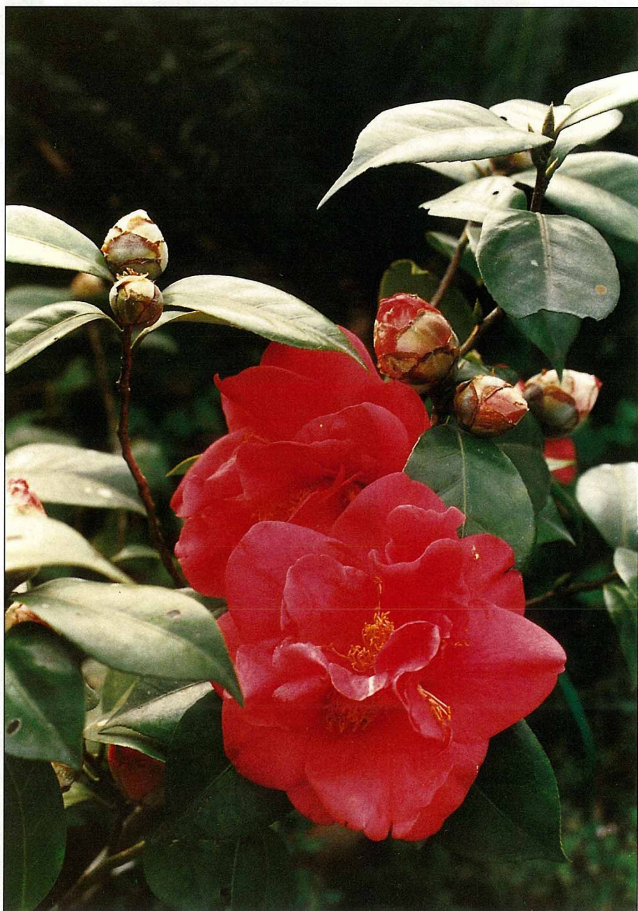
茶花不但有梅花的風骨，也兼含牡丹的鮮麗。

「山茶相對本誰栽？細雨無人我獨來，說似與君君不見，爛紅如火雪中開。」在這個嚴冬裡