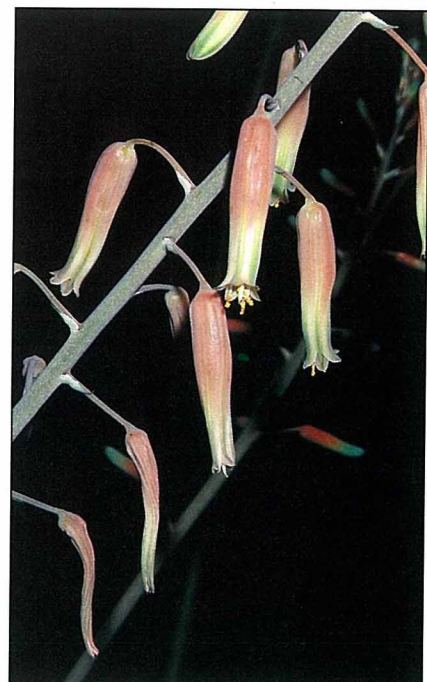
這串鈴噹，是多肉植物「賽錦」的花