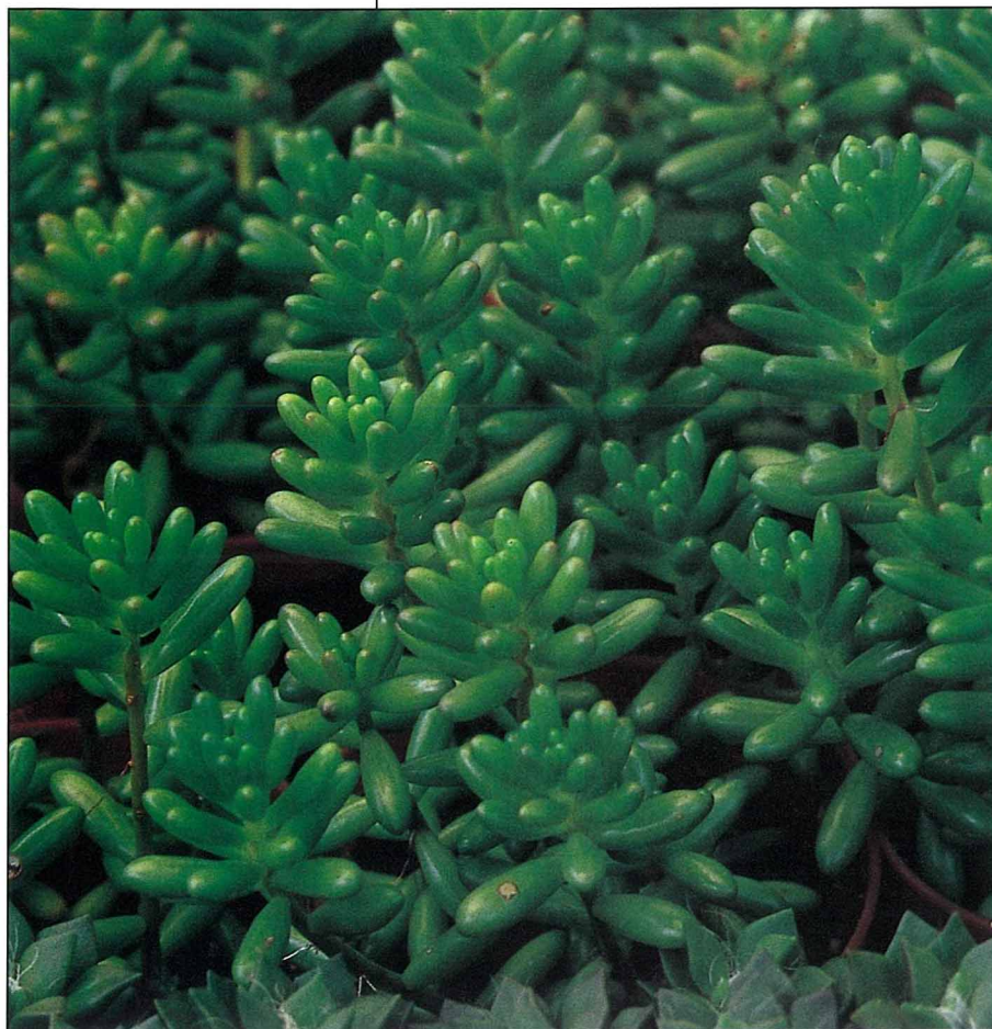
「金松玉」開花後，即結出一顆顆紅色的果子，觀賞期長達數月。

「不過，這和民族性很有關係，有的人是沒飯吃可以，沒花看就不行了！」任天順曾到過歐、美、日等地區遊歷，在這些地方的綠化場所中，他特別欣賞法國凡爾賽宮前的庭園，「他們的管理權責劃分，是以個人為單位，所以每個人對自己的責任區都是抱著戰戰兢兢的態度，不敢稍有怠惰。」然而國內公共地區的綠化工作皆採團體制進行，很容易因缺乏對團體的榮譽感，而忽略了種植之後最為重要的管理工作，再加上氣候、空氣等先天條件的失調，更加深維護上的困難，但是任天順認為，只要肯做，還是會有具體的成效。