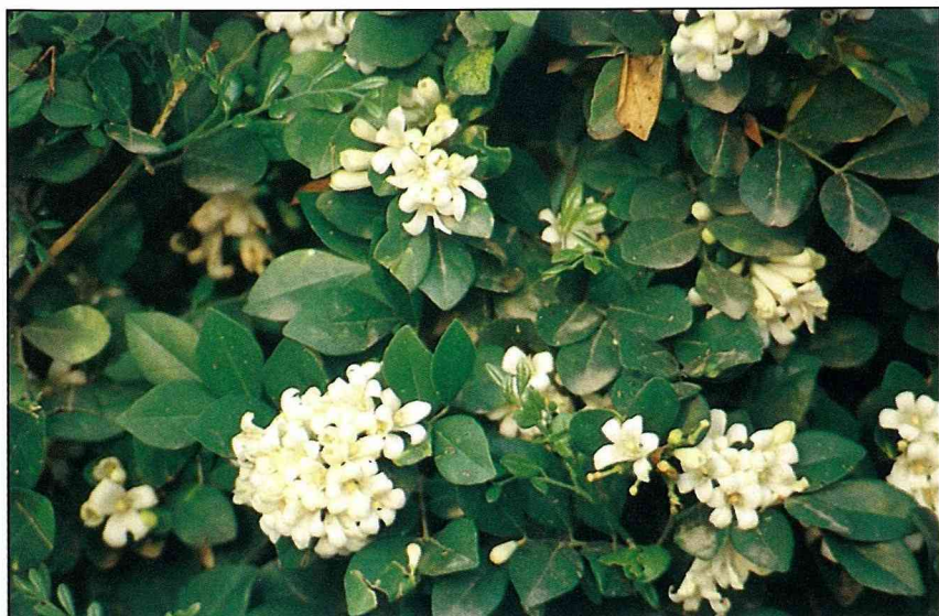
俗稱月橘的七里香，是柑桔的親戚，可做為嫁接的砧木，矮化樹型。

適當的防寒保暖和水分控制，通常是無法過冬的。七里香開花期特別喜愛日照，又對土壤和海拔高度的適應甚強。所以本省栽培七里香呈現欣欣向榮之象。