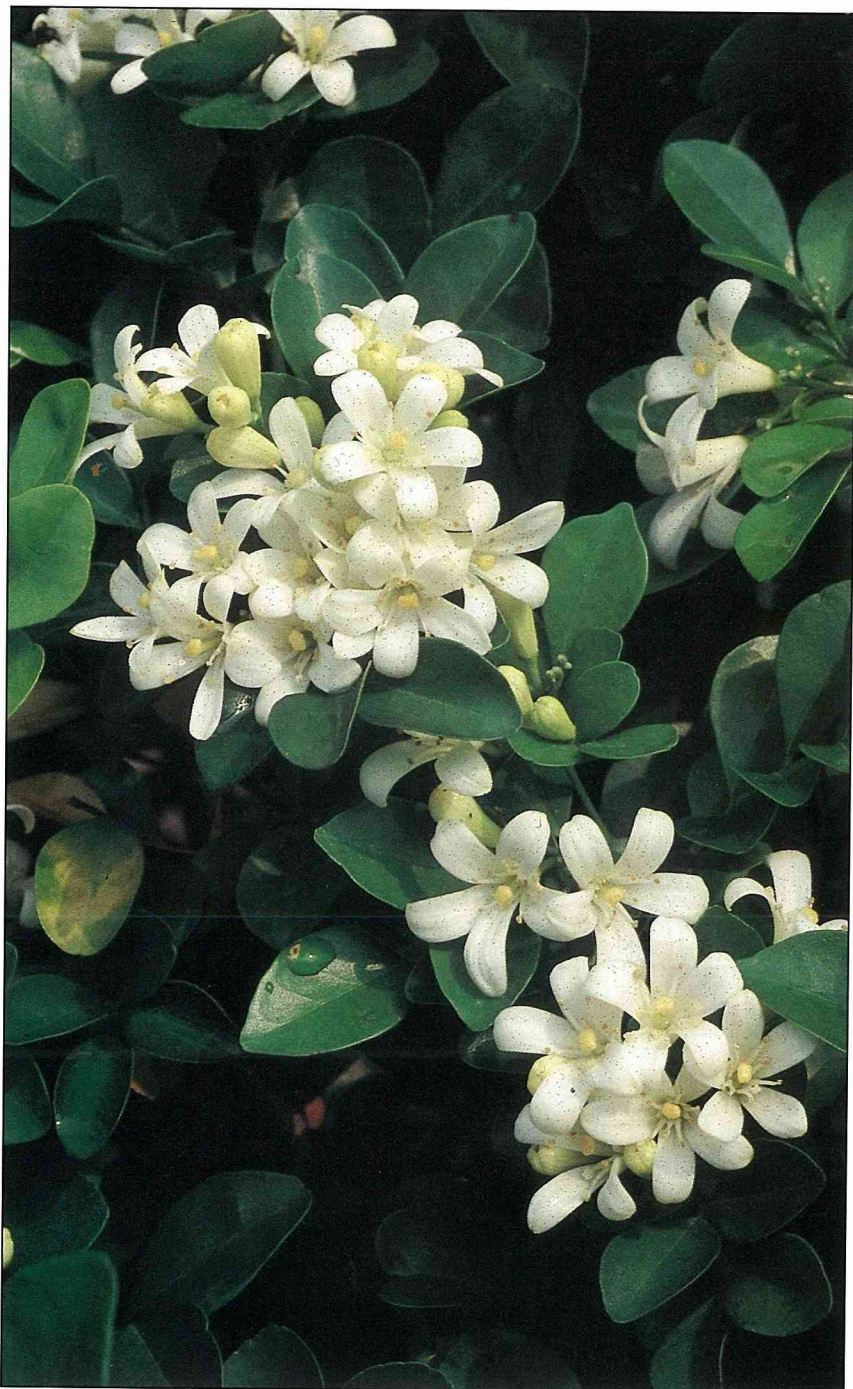
七里香，葉翠濃綠，四季常青，每年開兩季白花，是優美的庭園植物。

七里香是原產於亞洲熱帶及亞熱帶的芸香科植物，這種常綠灌木或小喬木，株姿秀麗，葉翠濃綠，四季常青，每年開兩季白花，芳香濃郁，香氣遠播，故有七里香、九里香、十里香、滿山香及月橘等雅稱。在我國西南、華南地區均有野生種的七里香，台灣亦有自生分布。本省園藝發達，七里香為庭園、環境美化、綠化中極優良的綠籬、盆栽植物，所以七里香的栽培甚普遍。