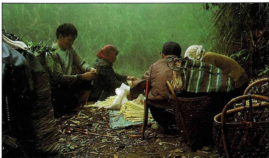
清晨，辛勤剝筍的泰雅族原住民。

「阿里」是泰雅族人對桂竹筍的稱呼，從名字上我們可以看出泰雅族人對桂竹筍的一種親切與愛惜之意；不僅是泰雅族人對桂竹筍感到親切，就連住在山區的客家人也曾經依賴著桂竹來生活，現在我們就從生活的面面觀，來探討桂竹對山區住民的影響。