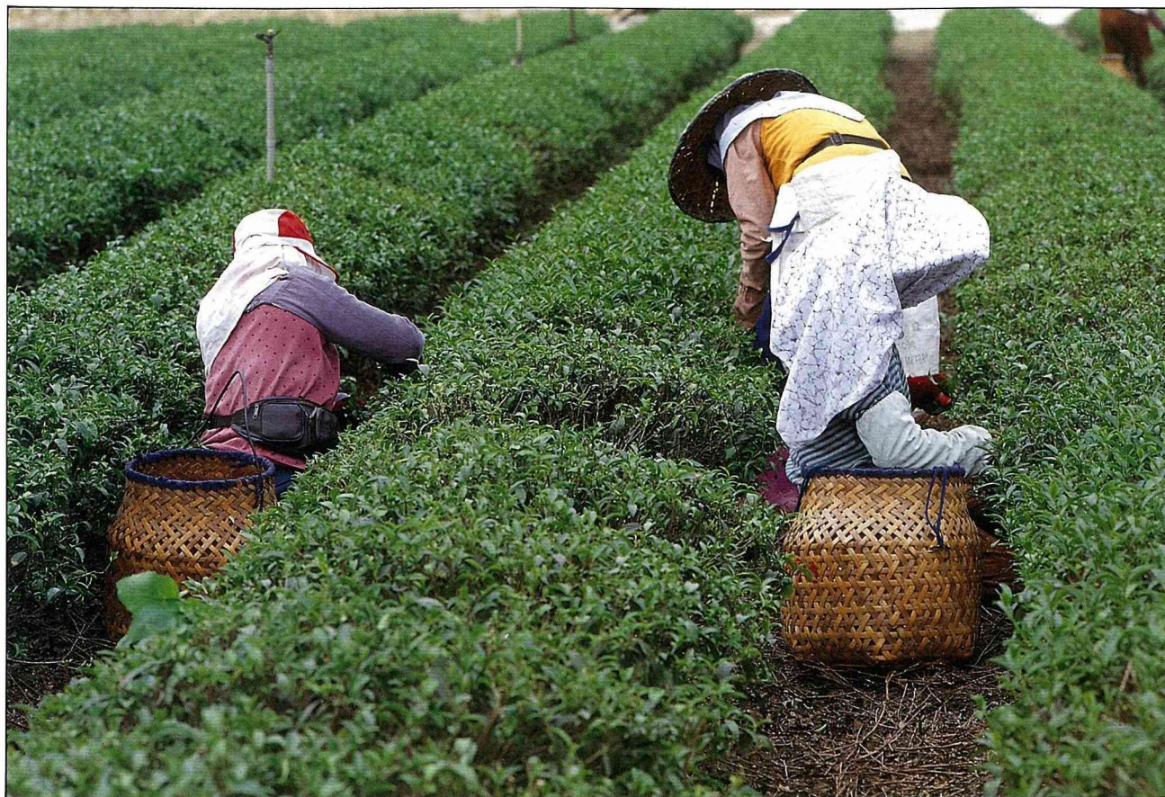
竹編茶籃，已不多見。

彈，就可在竹林中打起仗來，真是不亦樂乎，這種相當有趣又不花錢的遊戲，可讓小孩子瞭解惜物的精神。