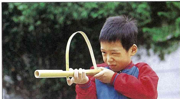
竹彈弓，小男孩的最愛。

解決孩童吵鬧時不得不出各種童玩的方法，例如竹蜻蜓、竹水槍、竹彈弓、竹煙斗、存錢竹筒、風箏……等，這些童玩很多都是要用簡單的工具就可以製作，