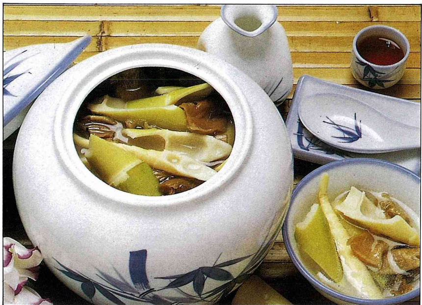
客家菜，桂筍福菜湯。(蘇寄萍／製作)

生 活環境通常會由地理環境來取決，山區住民住在高山上，在氣候、土壤、地形、降雨的各種自然條件下，會選擇適合栽種的農作物，而這些因素會因此限制某地區生物的適應力與生存，也因此這些限定的生物就和人類生活息息相關，並因此演化出該地區特有的文化背景。