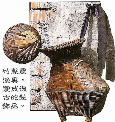
竹製農漁具，變成復古的裝飾品。

例如竹蜻蜓只要有鋸子、刀片及鑽孔用具即可，造型簡易，不過要使它真正飛上天，在製作上有些小技巧，那就是中心點的位置必須非常準確，才能非常平衡的向上飛；而竹槍製作上更簡單，只要找到筆直合宜的竹枝，鋸切後，再找一根竹棒做為推進器，利用大自然生長的種子做為子