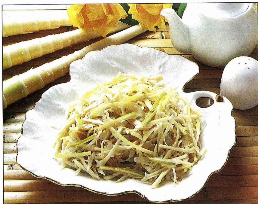
山地料理，桂筍薑絲。(蘇寄萍／製作)

單，只要把炒鍋加熱，放兩大匙沙拉油，把薑絲爆香後，加入煮好切過的筍絲拌炒，再加少許鹽巴即可。這道菜因為薑絲取得容易，山區住民多半兼種生薑，因而成為他們三餐伴飯的配菜。另外，用桂筍乾熬燉大骨的桂筍乾湯，味道甘美，而且一年四季都可以煮來吃。