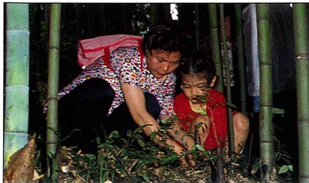
南庄鄉桂竹希望之旅活動

廣告索引：FTV生活傳真(封面裡) 恒春農場(15) 平林農牧場(32) 上湧公司(35) 東宇公司(36) 台灣銀行(37) 台和園藝公司(39) 宗慶/台企行/裕農種苗(41) 苜億企業公司(44) 香格里拉農場(46) 農林廳(56) 統一公司(封底裡) 台和園藝公司(封底)