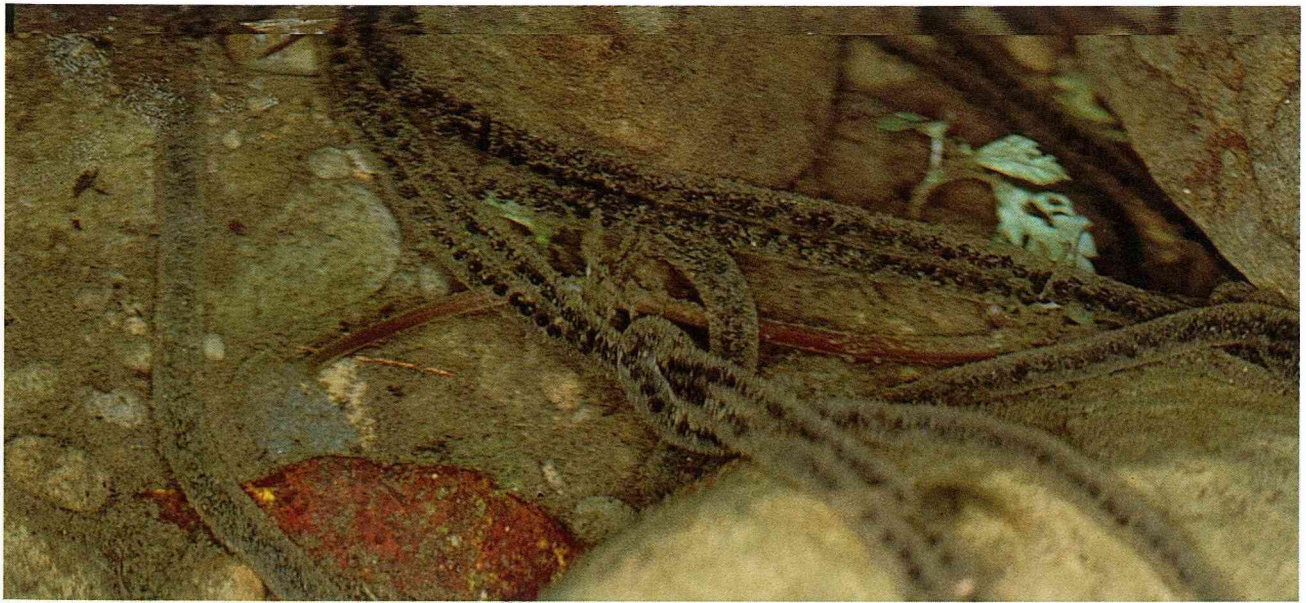
盤古蟾蜍的卵呈黑色，兩兩並列於長條狀的膠質膜中。

藥效，日製享有盛名的心臟藥「救心」，就是以蟾酥為其原料。由於蟾酥具有特殊藥效，因此價格貴如黃金。除了蟾酥之外，蟾蜍全身都可入藥，尤其肉及肝膽具有清肝解毒的功能。事實上，蟾蜍除了藥用經濟價值之外，在農業經濟上也有重要的貢獻。由於它們喜歡棲息在農耕地，又以昆蟲為食，因此是農作物害蟲的天敵。有鑑於它們控制害蟲的能力，台灣先民曾特地從大陸引進蟾蜍，野放到甘蔗園中。