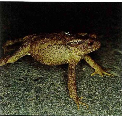
盤古蟾蜍擺出威武狀的防衛架勢。

雌蟾的體型比雄蟾大很多，也重很多，還扛得起這種戰爭。在這場混仗裏，最後勝利者通常是體型最大的一隻。待西線無戰事，雌蟾才願意帶著雄蟾到適當的地點準備產卵。它們的卵黑色，一次產數千顆，位於長條型的腸膜串中，長條型的腸膜串常常伸展在含泥沙的水底或纏繞在水草上。蝌蚪黑色，喜歡聚成黑鴉鴉地一大片。根據國外的研究報告顯示，構成一大群的蝌蚪之間通常具有親緣關係，例如兄弟姐妹或