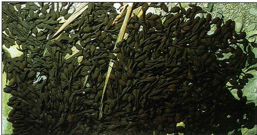
黑鴉鴉一大片的盤古蟾蜍蝌蚪。

盤古蟾蜍的生殖季節是在每年的9月到2月，此時平常喜歡在陸地上活動覓食的它們，也會就近遷移到溪流、水池等水域進行生殖活動。雄蟾到了水邊，有些會坐在岸邊，有些坐在水裏，有些則雙腳打開、半浮半沉的在水中游泳，不過基本上它們比較偏好水流緩而淺的地方。雄蟾沒有鳴囊，不會主動發出求偶叫聲吸引雌蟾接近，但它們會積極地將任何靠近它們會動的東西都當成求偶的對象，然後抱上去。原來癩蛤蟆並不想吃天鵝肉，它們是在向天鵝示愛，但最終的結果還是癡心妄想。有時候我也會對它們開開玩笑，騙騙它們的感情，把腳伸到它們的面前不斷地搖晃，它們就會自以為是青蛙王子，興奮地抱起我的腳呢！在生殖期間，雄蟾的第一、二指基部將出現明顯突起的黑色婚姻墊，藉此它們可以把雌蟾緊緊地抱住。由於它們不斷地主動出擊，難免會錯抱到其它雄蟾，此時被錯抱的個體會發出「咕、咕、咕」釋放叫聲，警告對方不要亂來。而成功獲得交配的個體也不得安寧，常常會受到其它雄蟾的攻擊，有時一隻雌蟾背上會有好幾隻雄蟾在爭得你死我活，激烈時還可能形成一團肉球，滾來滾去。好在