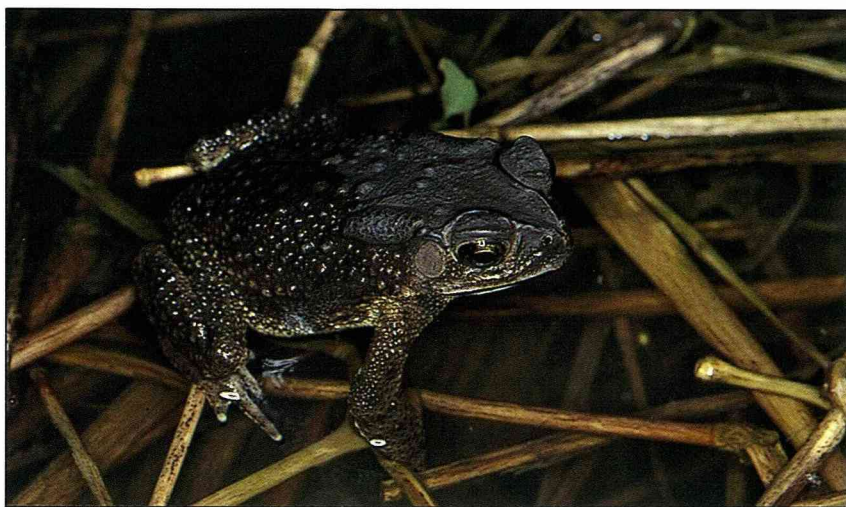
黑眶蟾蜍的特徵，從吻端到上眼瞼，有黑色稜狀物隆起。

其實要觀察動物的有趣行為，並不見得一定要爬高山或餐風露宿，在你度假的時候，也可以輕輕鬆鬆地就地取材，研究身旁的任何動物。只要你抱著欣賞、包容野生動物的心，縱使醜如蟾蜍，也能發現它們善良、天真的一面。蟾蜍算起來是和我們人類最親近的兩棲類，有空的時候不妨去拜訪它們，看看它們虛張聲勢的模樣，也是一件很有趣的事呢！