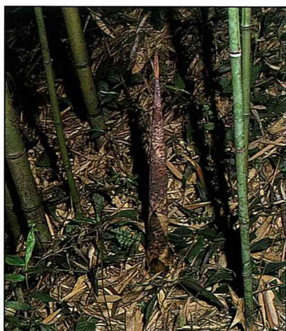
桂竹每年春天發筍。