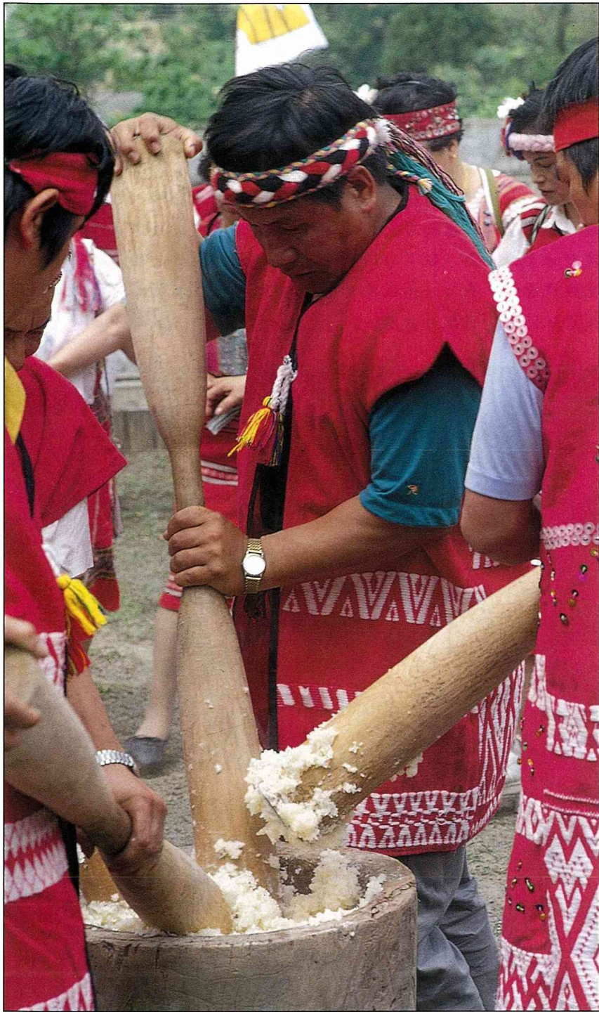
用木椿槌打製作山地糕。

我 們在新竹下了火車，轉搭苗栗客運往南庄鄉出發，今天是鄉農會主辦的「桂竹希望之旅」開幕式。車子駛過「頭份」之後，窗外的景緻漸漸褪去喧囂，換上清朗，車內的氣氛卻開