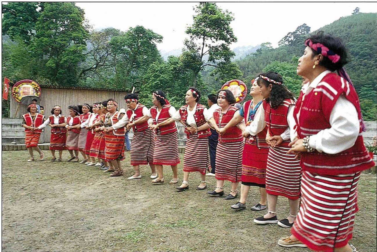
原住民婦女載歌載舞。