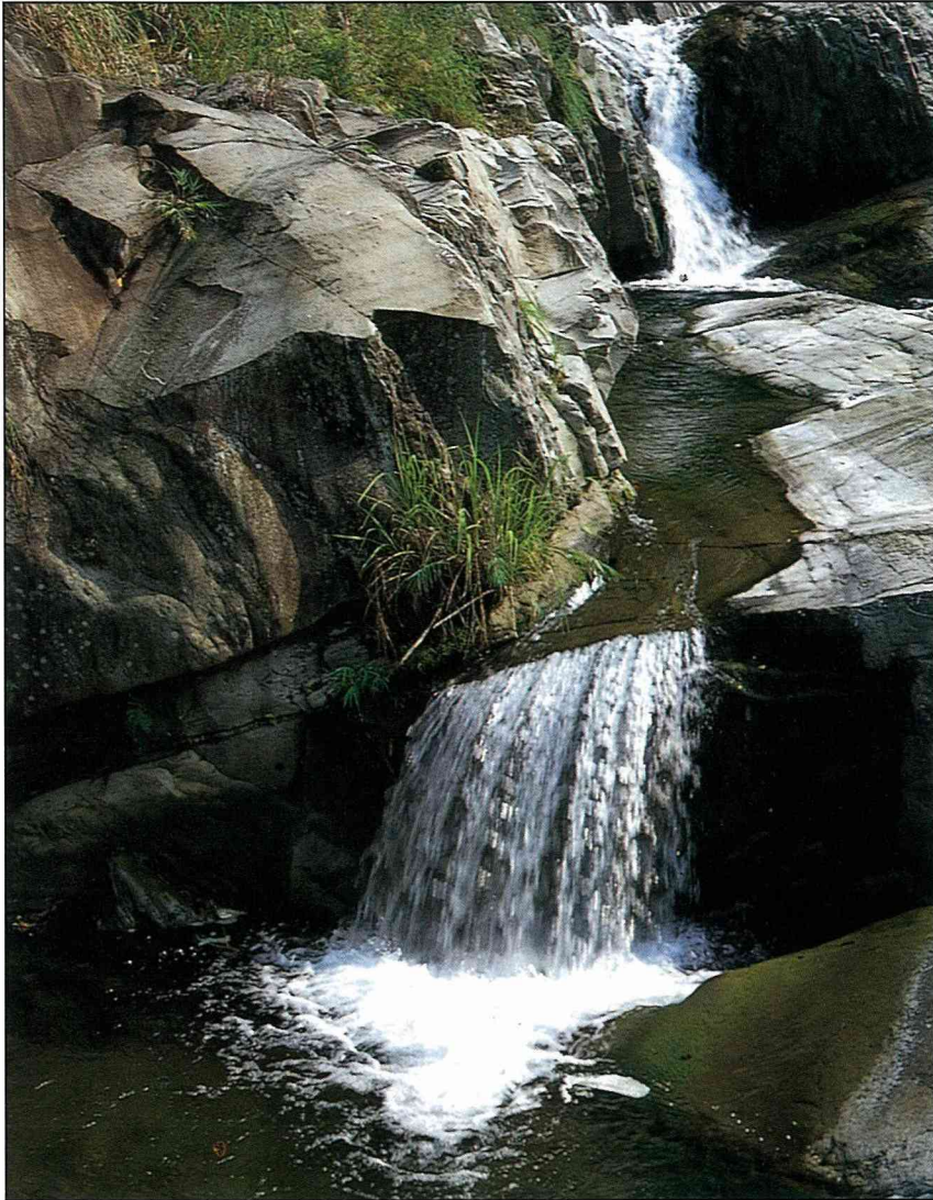
三角湖以削崖怪石及深邃湖水而著名。