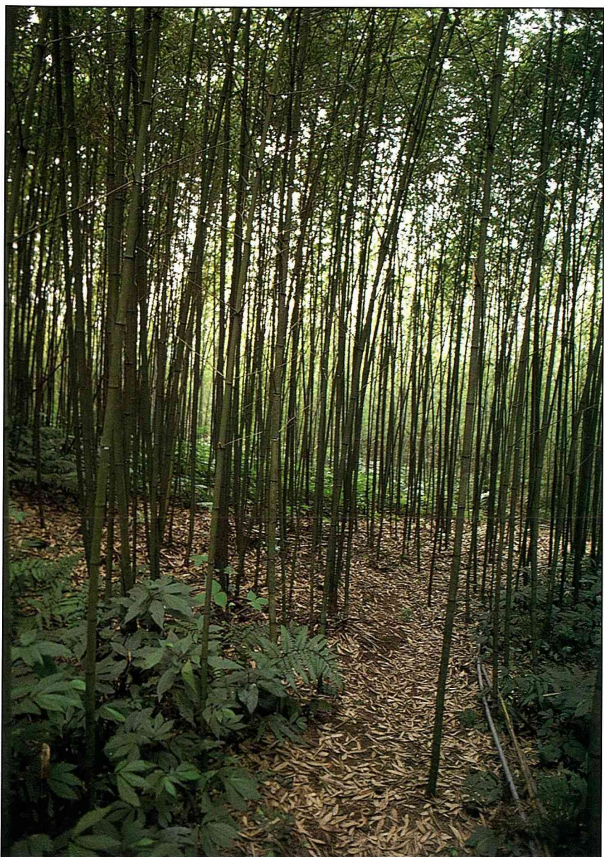
八卦力的優美桂竹林。

皮凍燒、桂筍薑絲、桂筍沙拉、桂筍鑲肉、米漿醃桂筍、桂筍乾湯、筍乾扣肉、桂筍小魚干炒、桂筍粉腸炒、桂筍豬肚炒和桂筍燴什錦等，展現桂筍料理的多樣性。桂筍含有豐富的膳食纖維，熱量又低，是能預防文明病的健康食品。