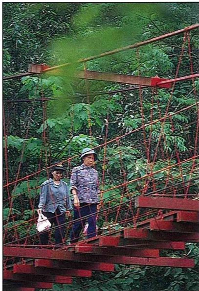
鮮紅的吊橋是八卦村的明顯地標。