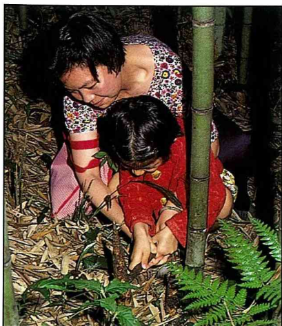
來自台北的唐太太，帶小女兒來體驗採筍。