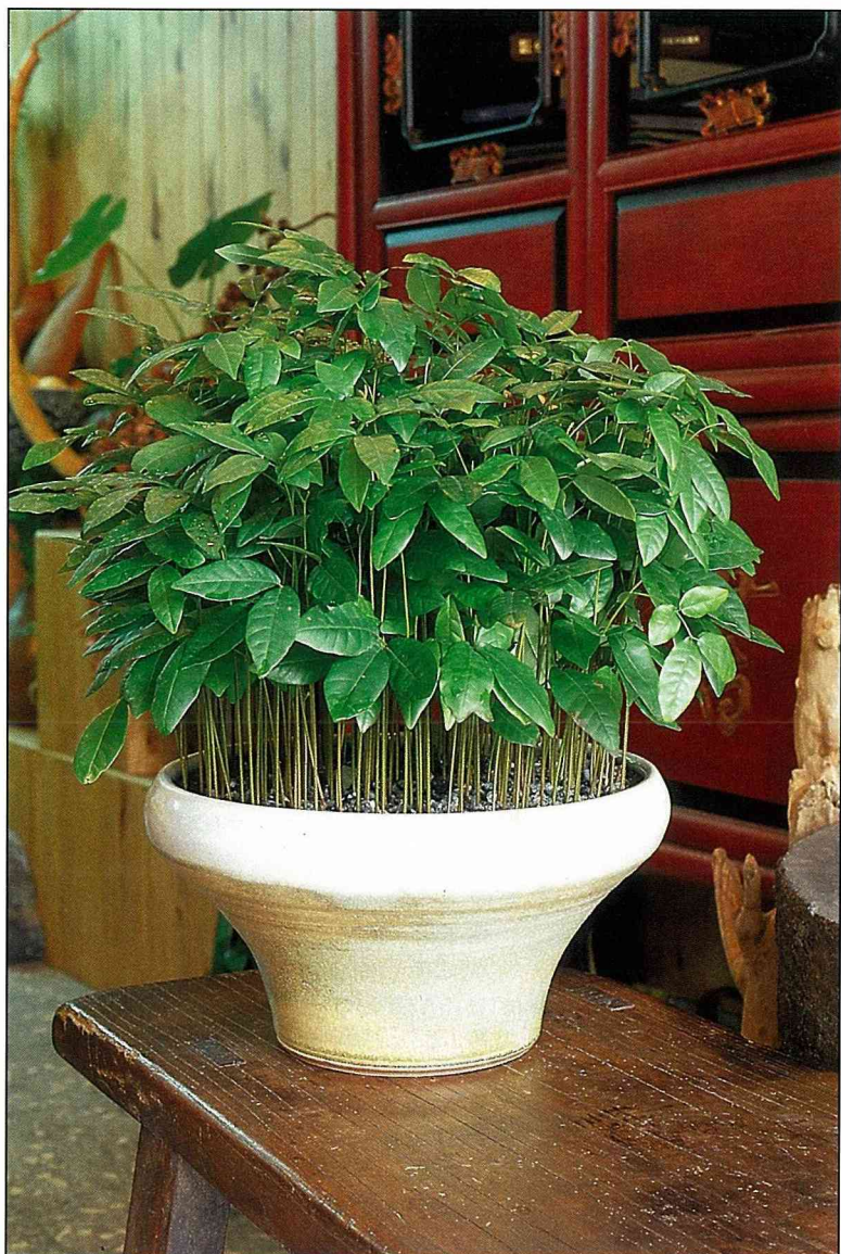
您猜得出這盆「龍眼」盆景，撒了多少粒種子？

喜歡吃龍眼或山竹的朋友， 建議您不妨利用夏季這段盛產期， 隨手將吃剩的果籽， 栽植成一盆盆的青翠， 讓綠意與田園之樂淨化你我的心靈！