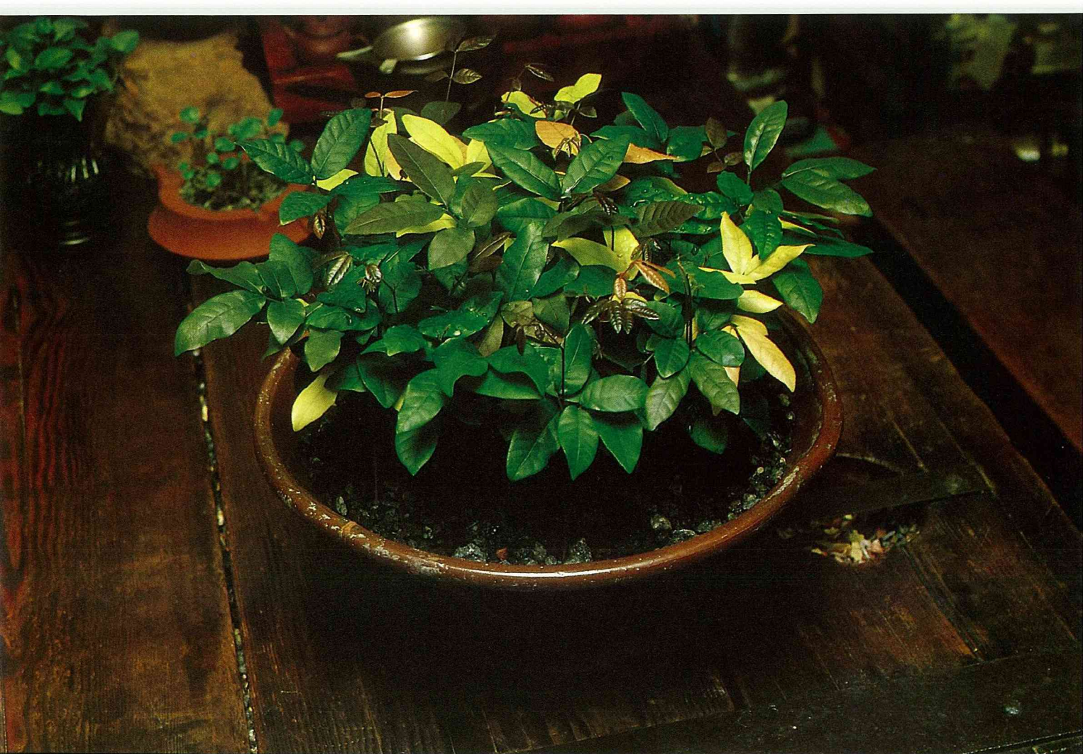
▲ 成長約2個月的「龍眼」植株，葉色已具多種變化。