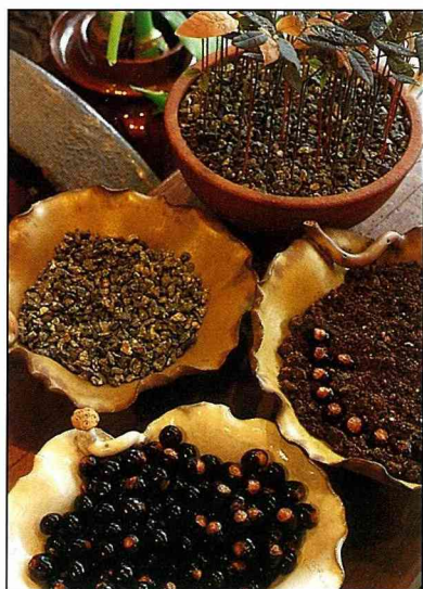
▲「龍眼」播種時，仍以緊密排列為原則。