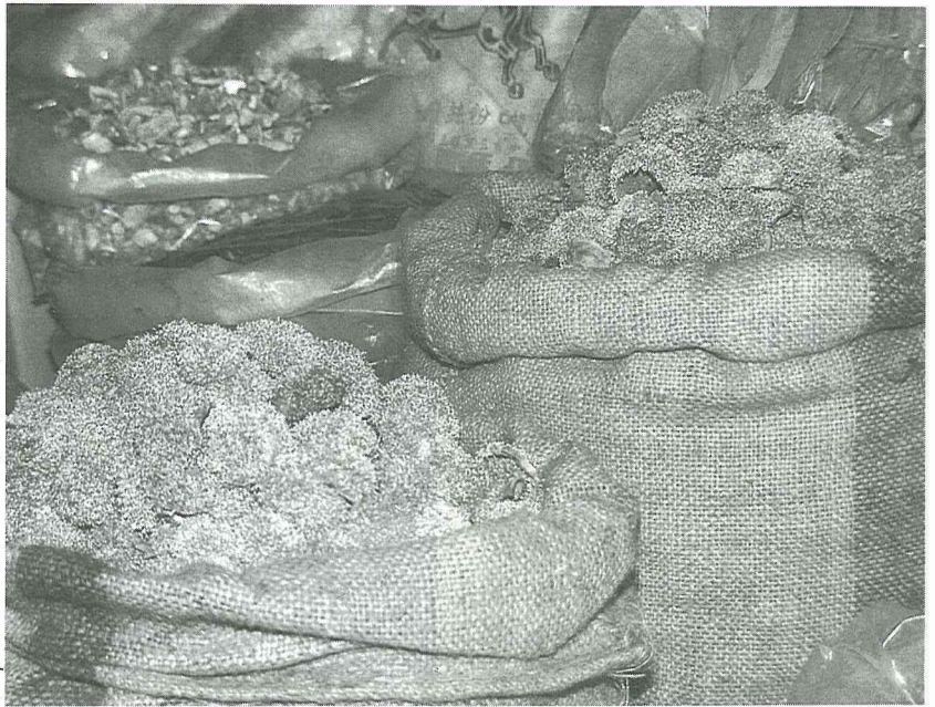
南北貨市場上可以買到連同果托的陽乾瘦果。

爲了避免買到晒乾期間被摻雜搓揉過的愛玉子，最好在市場上買連同果托一起的陽乾瘦果，如此才不會吃虧。