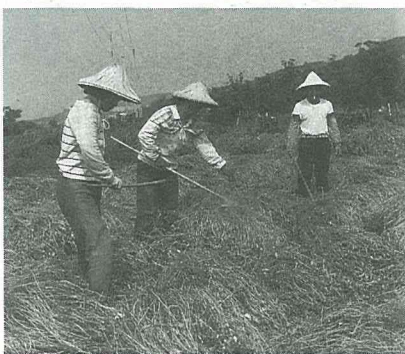
仙草植株採收之後，倒立田間曬乾。

為了讓讀者能安心食用仙草凍及仙草茶，筆者特地介紹了仙草凍及仙草茶的製作方法，也請讀者一起來動手吧！