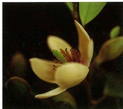
含笑花帶有香蕉香，在大晴天的時候，香味更烈。

更加濃冽，採取時以苞片裂開尚未脫落時香味最濃，是採收花苞的最好時光，太早或太晚香氣皆不佳。