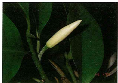
白玉蘭(即「玉蘭花」)此大小為最佳採收期

，大而美麗，苞片一片，萼片和花瓣明顯，易區別。果為蓇葖果，種子大，共計有10屬100餘種，分佈於北、中美洲、西印度、巴西、亞洲東部和馬來西亞等地，部份花具有濃厚香氣，是常見的香花植物之一。