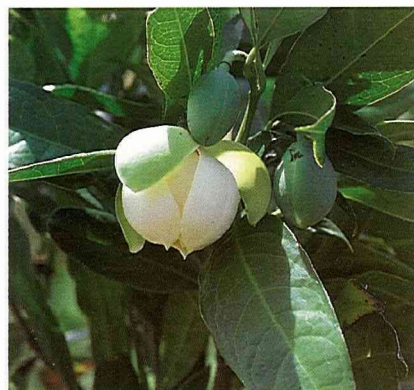
夜合花，因花朵夜晚閉合而得名。

含笑花可以扦插法或高壓法繁殖。在7~9月間取未發新梢、充實且已木質化之頂芽長12公分，留3~5片葉後扦插，3個月左右即可生根，高壓法則宜在盛花過後進行。其他栽培管理和玉蘭花類似。含笑花有香蕉香味，尤其在陽光普照的大晴天裡，香氣