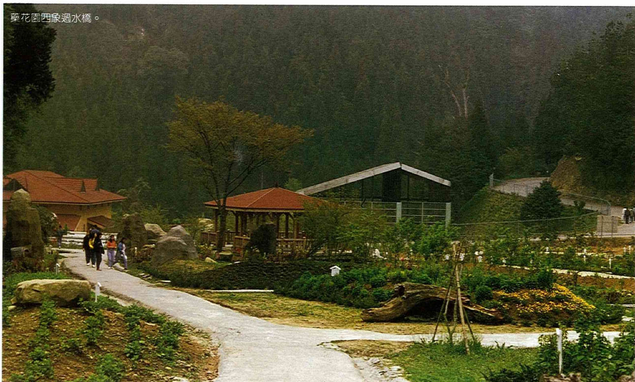
藥花園四象過水橋。

杉林溪是本省有名的遊覽勝地之一。海拔1,600公尺的位置，讓她遠離塵囂，尤其夏季平均20°C的溫度，更讓人嚮往；有句話就是這麼形容杉林溪的原始美：「遊杉林溪啊，在樹下聽鳥語，在河邊伴魚遊，在谷中飲清泉，在嶺上舞流雲，猶如身在仙境。」