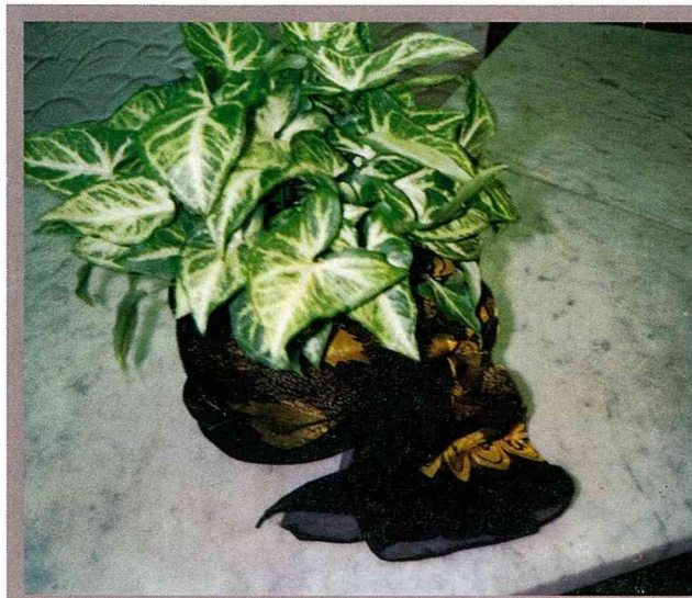
合果芋用絲巾包裝，有柔和浪漫的風格。