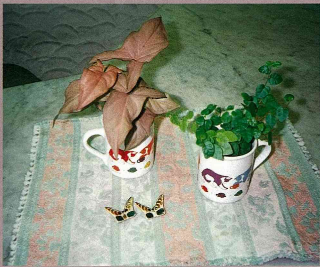
錦葉合果芋(左)搭配薛荔成可愛的小品組合。

合 果芋是近年新興的室內植物，由於科技的發達，更造就許多的斑葉品種，使得室內植物更富色彩、增添變化。合果芋來自熱帶美洲，喜高溫多濕，適應力強，因此適合室內栽培，一般人也能輕鬆照顧。