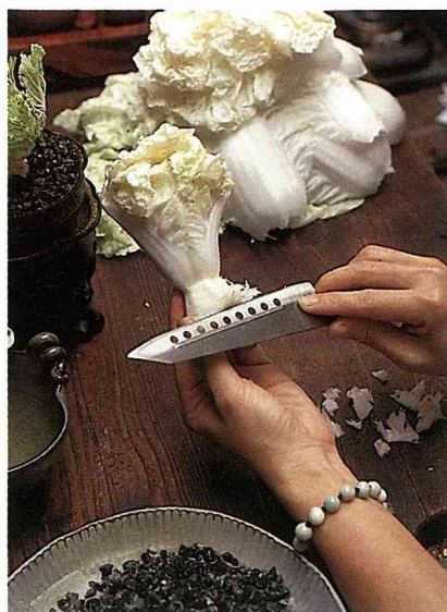
1. 在種植前，菜梗上餘留的葉必須先切除乾淨。

白菜：別名包心白菜、山東白菜等，屬十字花科，為一或二年生植物。外葉寬大有皺紋，色