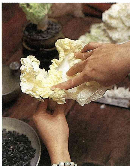
2. 將葉部由內向外攤開，並向下稍壓使展開。