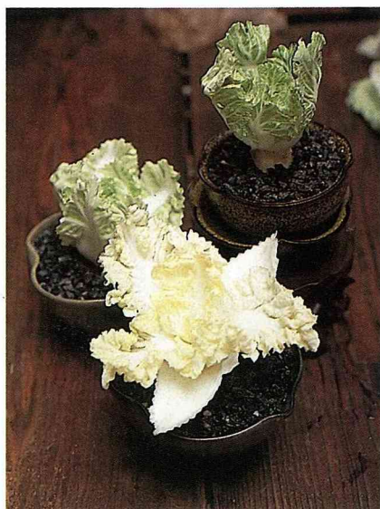
3. 用剪刀將葉緣修剪至適當大小，即可準備固定於容器內。

濃至淡綠，表面具毛或光滑則因品種而異；葉柄白或白綠；內葉黃或白色；花黃，花莖可高達1公尺。